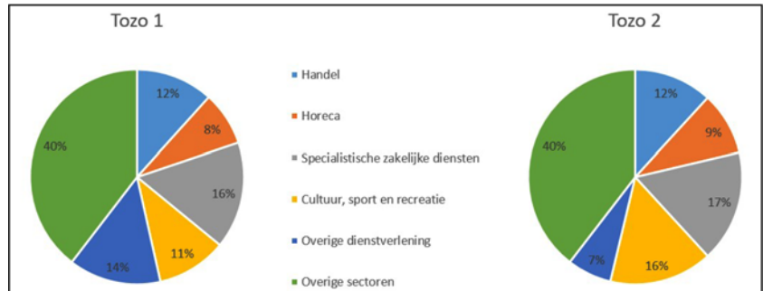
Figuur 2: Bedrijven van personen met Tozo levensonderhoud naar sector, gemiddeld per Tozo regeling

Het CBS geeft in de definitieve tabellen ook het aantal Tozo verstrekkingen per gemeente en sector weer. Hierin zien we het beeld uit de snelle monitoring terug dat er een relatief groter beroep op de Tozo wordt gedaan in de G4 en andere grote steden dan in middelgrote en kleine gemeenten. Ondernemers die een beroep deden op de Tozo zijn vooral actief in de sectoren specialistische dienstverlening, cultuur, sport en recreatie, handel, horeca en overige dienstverlening. Uit Figuur 2 blijkt dat zowel onder de Tozo 1 als de Tozo 2 gemiddeld 60% van de verstrekte uitkeringen naar ondernemers in die sectoren ging. In de Tozo 2 nam het relatieve aandeel van de cultuur, sport en recreatiesector toe terwijl dit voor overige dienstverlening afnam.