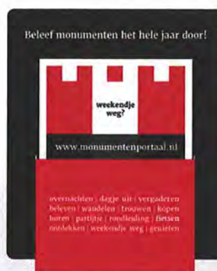
Informatiekaartje met display (Ontwerp: Degen & Leideritz)

Het Nationaal Monumenten Portaal is een initiatief van de Nationale Monumentenorganisatie