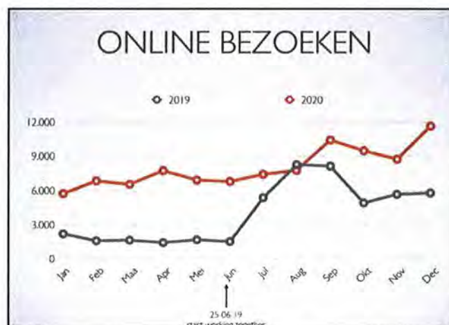
De online bezoeken aan het Monumentenportaal in 2020, vergeleken met 2019

Naast communicatie over het portaal op sociale media (LinkedIn, Facebook, Instagram), werd in 2020 opnieuw met behulp van het bureau INTK ingezet op het vergroten van het aantal bezoekers van het portaal. Dit bureau zet op professionele wijze de Google Grants in die aan de NMo als ANBI beschikbaar is gesteld. Deze inzet heeft in 2020 geresulteerd in ruim 96.200 bezoeken aan de website van het Monumentenportaal. Dit is een verdubbeling (+99%) ten opzichte van 2019 en komt neer op gemiddeld ruim 8.000 bezoeken per maand. De bezoekersaantallen waren in december 2020 het hoogst: deze maand werd afgerond met 11.650 bezoeken. De gemiddelde tijd die bezoekers in 2020 spendeerden op het portaal is lang: meer dan 3 minuten.