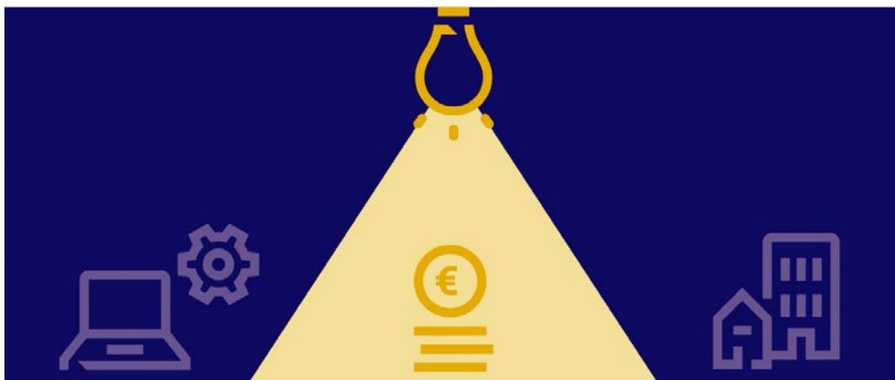
Figuur 1: Huidige jaarverslagen ministeries belichten alleen financiële bezittingen