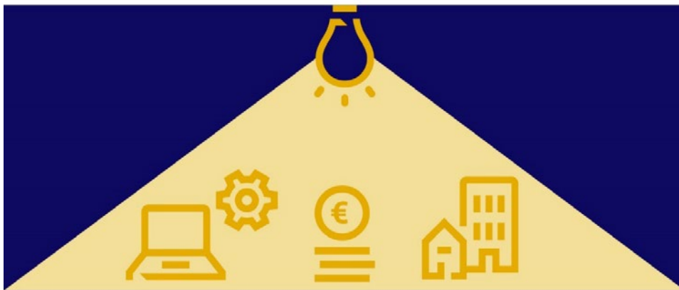
Figuur 6: Alle rijksbezittingen verdienen het te worden belicht