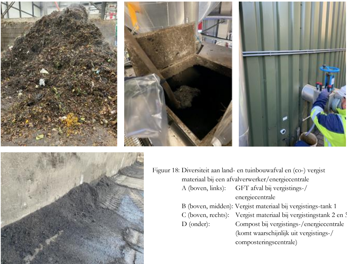
Figuur 18: Diversiteit aan land- en tuinbouwafval en (co-) vergist materiaal bij een afvalverwerker/energiecentrale A (boven, links): GFT afval bij vergistings-/energiecentrale B (boven, midden): Vergist materiaal bij vergistings-tank 1 C (boven, rechts): Vergist materiaal bij vergistingstank 2 en 3 D (onder): Compost bij vergistings-/energiecentrale (komt waarschijnlijk uit vergistings-/composteringscentrale)