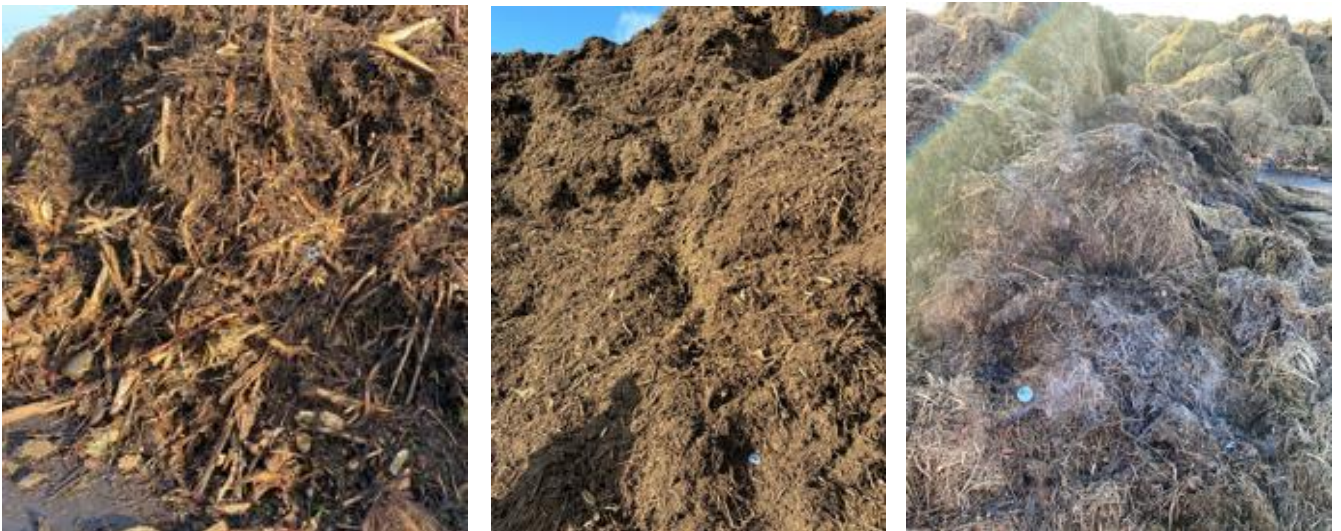
Figuur 12: A (links): Groenafvalhoop biomassawerf A, met resistente Aspergillus B (midden): Groenafval (versnipperd) biomassawerf C, met resistente Aspergillus C (rechts): Groenafval (maaisel) biomassawerf C, met resistente Aspergillus

Bij de biomassawerven zijn de aanwezige inputstromen zoveel mogelijk separaat bemonsterd. Bij biomassawerven A en C waren de inputstromen relatief homogeen (zie figuur 12 hieronder).