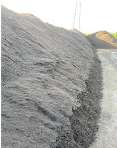
Figuur 15: Compost als eindproduct op de biomassa-werf; niet of nauwelijks resistente Aspergillus , temperatuur gedaald naar 31 °C.

In tabel 3.12 hieronder is het percentage monsters met een hoog (> 1000 CFU/g) gehalte resistente Aspergillus weergegeven. In groenafval op de biomassawerven is sprake van hoge resistentie in 63% van de monsters. Soms worden azolen aangetroffen. In het composteringsproces neemt het aantal resistente A. fumigatus sterk af.