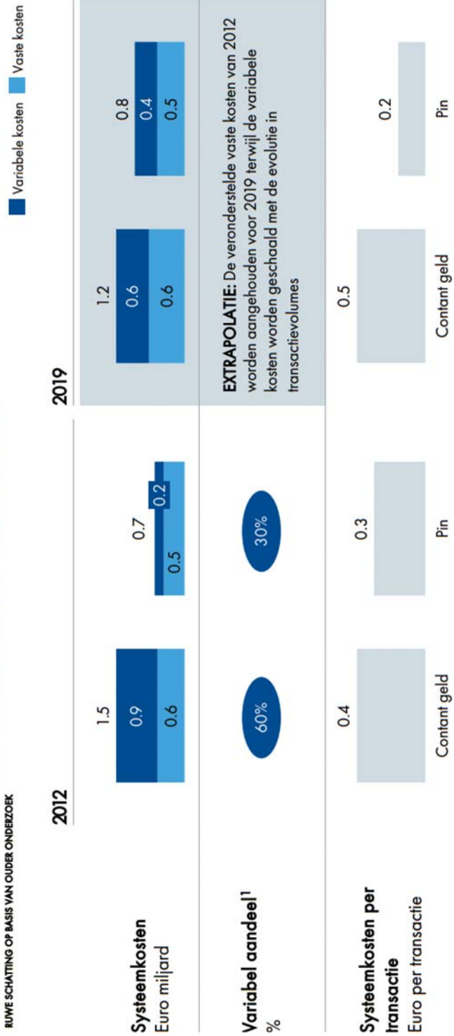
Figuur 6 Evolutie van de systeemkosten van het betaalverkeer in Nederland RUWE SCHATTING OP BASIS VAN OUDER ONDERZOEK