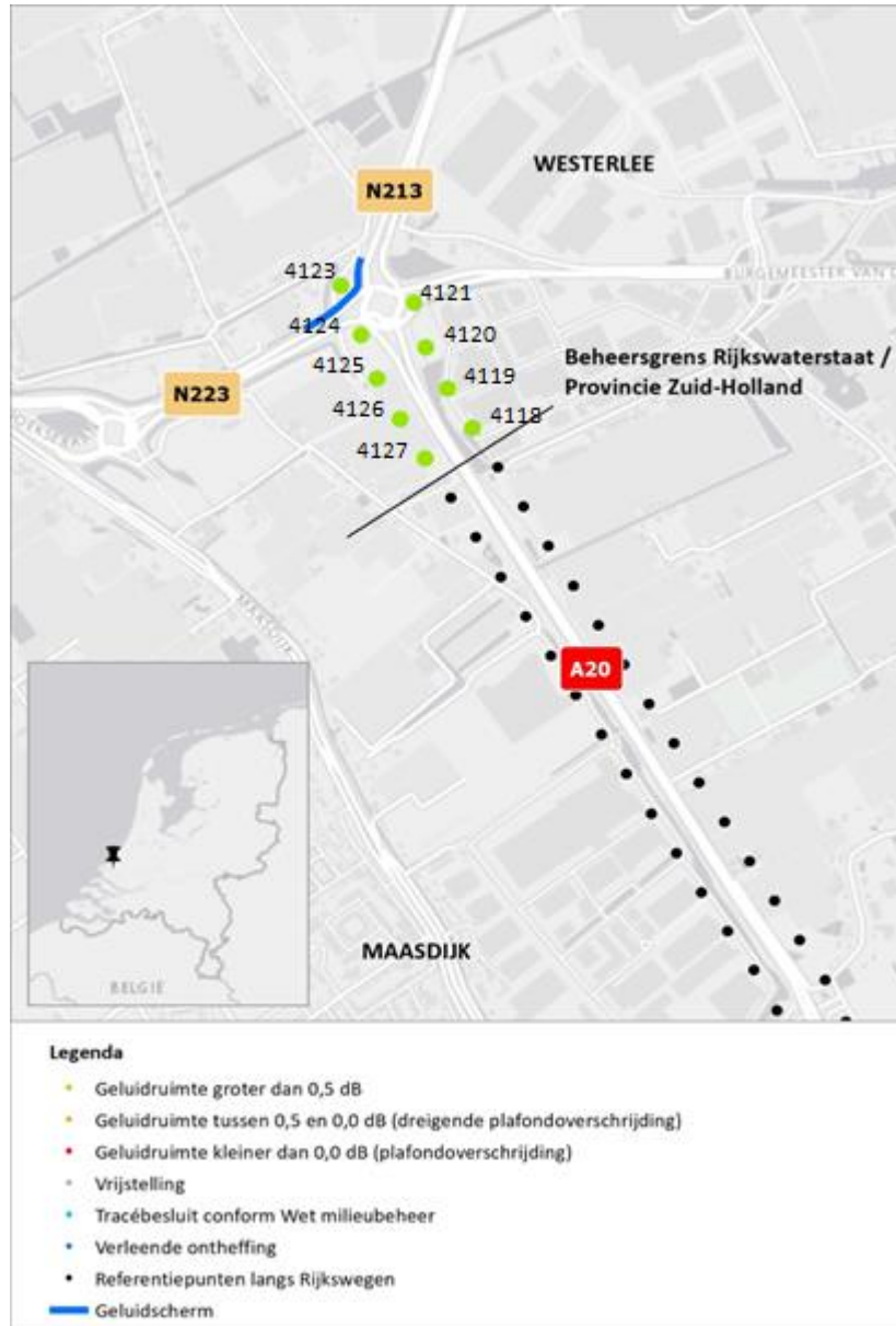
Figuur 2 Geluidruimte naleving 2020 t.o.v. geldende geluidproductieplafonds provinciale wegen