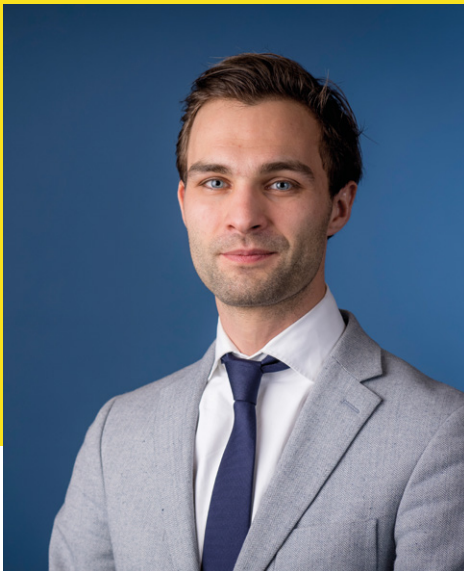
Maarten van Ooijen Staatsecretaris van Volksgezondheid, Welzijn en Sport

In dit boekje vindt u verhalen van 23 wethouders die hebben deelgenomen aan dit netwerk. Zij vertellen wat ze hebben bereikt, hun drijfveren en visie en wie hen heeft geïnspireerd. Ook geven zij tips aan collega's in andere gemeenten. Ik hoop dat hun verhalen u inspireren om net als deze wethouders aan de slag te gaan met het verbeteren van het jeugdbeleid, zodat alle jongeren gezond en veilig kunnen opgroeien.