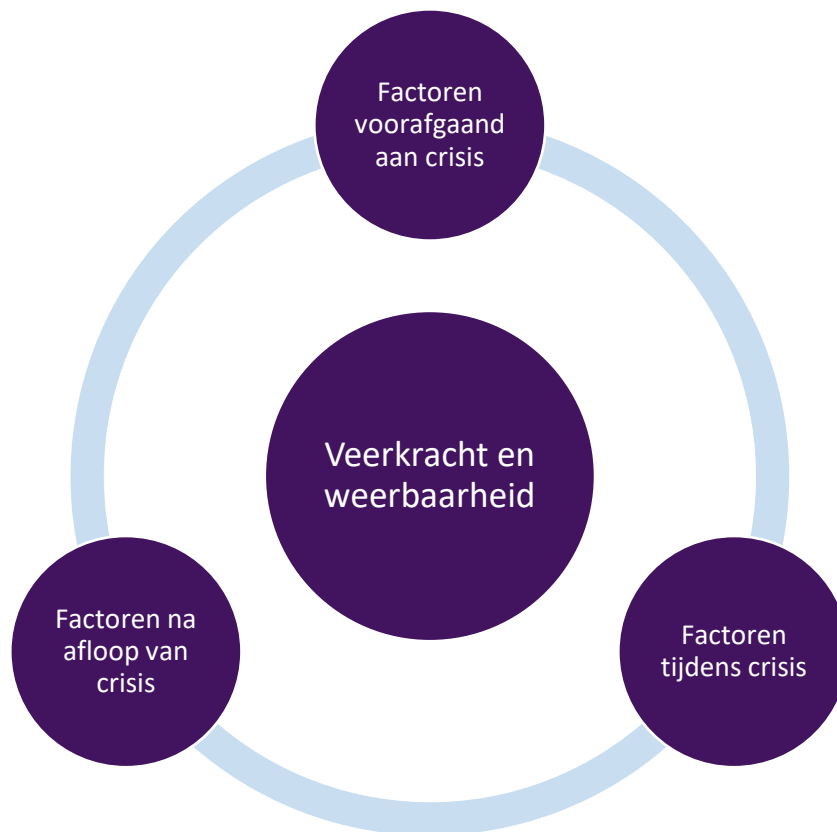
Figuur 1. Voor, tijdens en na crises: veerkracht en weerbaarheid als cyclus