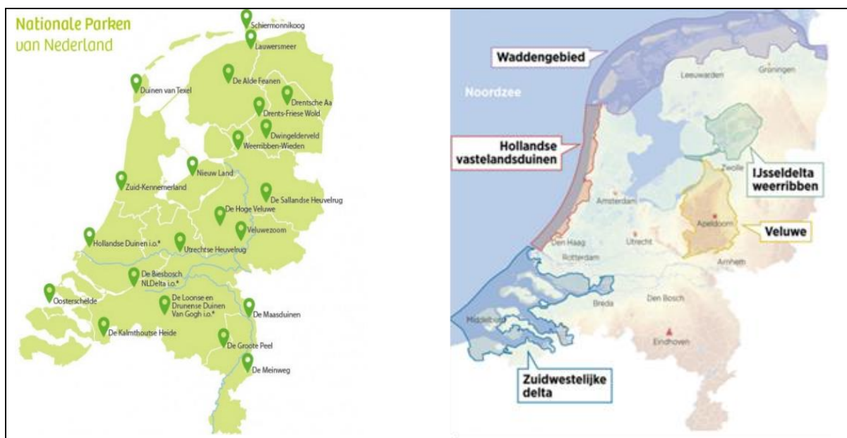
Figuur 2 Links de Nationale Parken en Nationale Parken in oprichting in Nederland. Rechts de voorgestelde selectie en begrenzing van vijf Nationale Landschapsparken door de Commissie Verkenning Nationale Parken.

In haar advies pleit de Commissie ervoor deze gebieden Nationale Landschapsparken te noemen. Deze gebieden zijn volgens de Commissie van internationale betekenis en voldoen aan de UNESCO-criteria. Daarmee onderscheiden ze zich van de Nationale Parken 'nieuwe stijl' en de oude, bestaande Nationale Parken (i.e. parken die de status van Nationaal Park hebben verkregen vóór 2018), die volgens de Commissie alleen van nationale betekenis zijn.