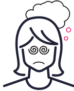
Dingen zien die er niet zijn