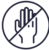
فقدان الشعور في اليدين والقدمين