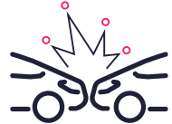
التسبب في حوادث السير