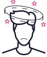
الشعور بالدوار والارتباك