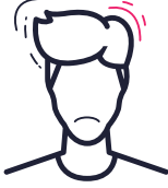
ألم في الراس

يمكن أن يكون لاستخدام أكسيد النيتروز تأثيرات إضافية جد مزعجة.