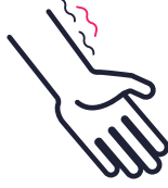
ارتخاء في الذراعين والساقين