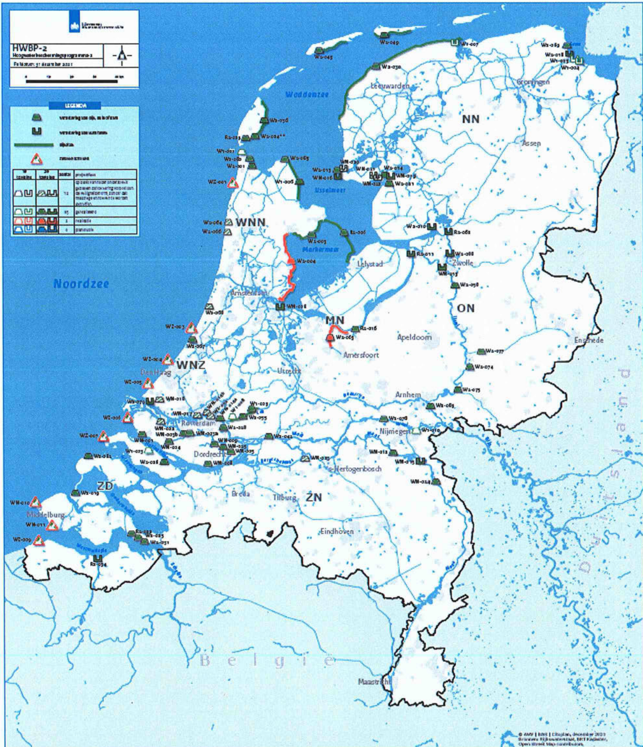
Figuur 2 Actuele scope van het programma, peildatum 31 december 2021