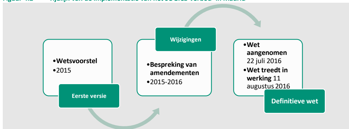
Figuur 4.2 Tijdslijn van de implementatie van het SOGICE-verbod 1 in Madrid

In 2015 bracht de politieke partij Partido Popular een wetsvoorstel in ter bevordering van de rechten van LHBTI+-personen. Andere politieke partijen waren op dat moment ook bezig met het voorbereiden van een wetsvoorstel. Het wetsvoorstel werd door het parlement besproken, waarbij een groot aantal amendementen werd voorgesteld. Er werd, zoals gebruikelijk is in dit soort processen, een commissie ingesteld met vertegenwoordigers van verschillende politieke partijen. Deze commissie besprak de wet per artikel, steeds met als doel tot een voor iedereen acceptabele formulering te komen. In dit proces werden ook LHBTI+-belangenorganisaties geconsulteerd. Religieuze en levensbeschouwelijke organisaties zijn niet door de commissie geconsulteerd. Een van de politici die aan de commissie deelnam, gaf aan dat het 'niet gebruikelijk' is om religieuze organisaties te consulteren, al is het mogelijk dat zij door sommige partijen achter de schermen wel zijn geraadpleegd. De aangepaste versie van de wet werd op 14 juli 2016 unaniem door het parlement aangenomen.