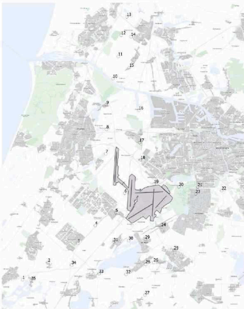
Figuur 1: De handhavingspunten rondom Schiphol