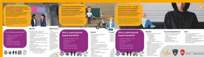
Flyers voor hulpverleners, onderwijs en ouders

Wil je meer weten over de aanpak van de Task Force Jeugdige Ondernijmers? Neem dan gerust contact op via: MRiec-tfjo.limburg@politie.nl .