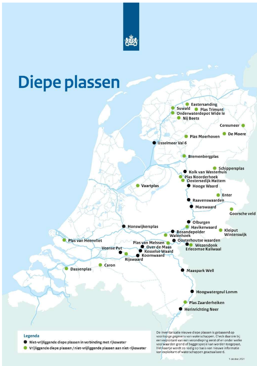
Figuur 1: een overzicht van de locaties waar diepe plassen verondiept (gaan) worden