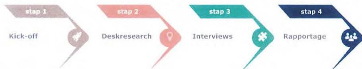
Figuur 1: stappenplan

Om de evaluatie uit te kunnen voeren, conclusies te kunnen trekken en aanbevelingen te kunnen doen, is informatie verzameld. Daarvoor zijn de volgende stappen doorlopen: