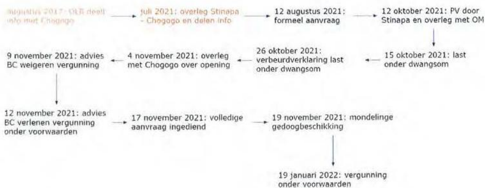
Figuur 3: de belangrijkste momenten op een rij

De vergunning, met daarin onder andere opgenomen dat voor 31 maart 2022 Chogogo moet voldoen aan een aantal voorwaarden (onder andere ten aanzien van de keermuur), is op 19 januari 2022 verstrekt. Ten tijde van het verstrekken van de vergunning is de uitslag van het onderzoek dat het OLB laat uitvoeren naar de kwaliteit van het gebruikte zand nog niet bekend.