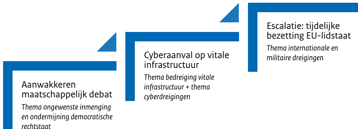
Figuur 12 Escalatieladder met de drie ‘hybride’ Rusland scenario’s in drie verschillende dreigingsthema’s

Te midden van spanningen tussen Rusland en Finland, waarbij Rusland middels verschillende kanalen de Europese bevolking ervan probeert te overtuigen dat Finse toetreding tot de NAVO een slecht idee is, wordt het maatschappelijke debat rondom vluchtelingen opnieuw aangewakkerd. In dit scenario faciliteert Rusland een grote vluchtelingenstroom richting de EU, waarbij push-backs aan zowel de zuidelijke als de oostelijke grenzen van Europa op grote schaal worden uitgelicht in de media. Het belangrijkste narratief dat Rusland poogt te laten aanslaan bij de bevolking van EU- en NAVO- lidstaten is dat de EU een incompetente en hypocriete institutie is, zonder enig bestaansrecht. Bovendien wordt een gestage troepenopbouw aan de westelijke grenzen van Rusland gesignaleerd. Er is onenigheid binnen de EU of dergelijke troepenopbouw een militaire reactie van de EU vereist (omdat Finland dus nog geen lid is van de NAVO), waarbij sommige lidstaten zelfs zover willen gaan artikel 42.7 in te roepen. Het belangrijkste effect dat Rusland in dit scenario zal beogen is het verdelen van de EU (en daarmee een groot deel van de lidstaten van de NAVO) en besluitvorming te beïnvloeden. Het is echter maar de vraag in hoeverre dergelijke verdeeldheid een structurele impact heeft op de besluitvorming van de EU (en de NAVO). Uiteindelijk leidt de troepenopbouw niet tot militaire acties van Rusland op EU/NAVO grondgebied, en lijkt de toegenomen spanning met een sissers af te lopen.