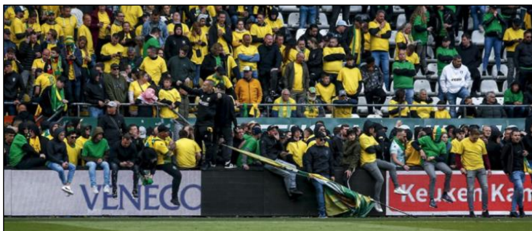
Situatie tijdens de wedstrijd ADO Den Haag – Excelsior Rotterdam op 29 mei 2022.

Tijdens de verlenging en in aanloop naar de strafschoppenserie klommen al veel ADO-supporters op het veld. Toen de arbiter de wedstrijd in de verlenging stil legde in verband met de supporters langs het veld en op de boarding, keerden deze supporters even terug naar de tribunes. Maar rond de strafschoppenserie kwamen zij wederom het veld op en bleven achter, op en voor de boarding, hetgeen een dreigende situatie opleverde voor spelers en officials.