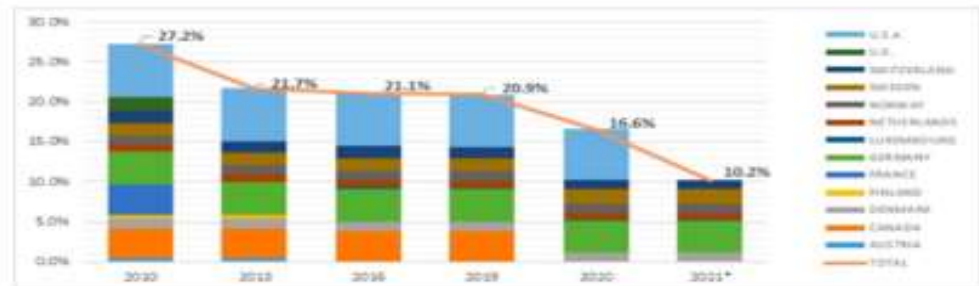
Figuur 1. Afname garantiestelling AfDB

Leek de financiële positie van de Bank jarenlang onwankelbaar – vooral door rugdekking in de vorm van garanties door lidstaten met een AAA-kredietstatus – het uitbreken van de Covid-19-pandemie bracht hierin verandering. Niet alleen zag een aantal Afrikaanse lidstaten hun kredietstatus naar beneden toe bijgesteld, waardoor de Bank extra risicokapitaal opzij moest zetten, ook Canada en de Verenigde Staten kregen te maken met een neerwaartse bijstelling van hun kredietstatus of een waarschuwing daartoe. De garantiestelling door AAA-lidstaten nam hierdoor met de helft af (vanaf 2010 gerekend met zelfs bijna twee derde), door factoren waarop de Bank geen invloed heeft.