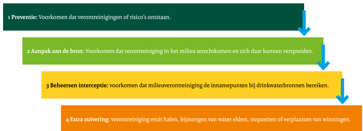
Figuur 3: Preventieladder voor de bescherming van drinkwaterbronnen

Bevoegde gezagen gebruiken de preventieladder (figuur 3) bij het formuleren en beoordelen van maatregelen gericht op de bescherming van de bronnen. De besluitvorming over de implementatie van de preventieladder ligt bij het bevoegd gezag – in overleg met de drinkwaterbedrijven en hun eigenaren – en vindt plaats binnen de bestuurlijke afwegingsruimte van het gebiedsgerichte beschermingsbeleid. In de praktijk is echter soms onduidelijkheid over de precieze toepassing van de preventieladder. Daarom wordt een handreiking uitgewerkt voor het toepassen van de preventieladder, met name voor situaties waar bronaanpak niet meer mogelijk is.