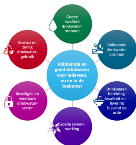
Figuur 1: Doelen van de Beleidsnota Drinkwater 2021-2026

In 2021 heeft het kabinet de Beleidsnota Drinkwater 2021-2026 vastgesteld. De Beleidsnota Drinkwater benoemt de ambitie voor de drinkwatervoorziening, beschrijft de opgaven op het gebied van drinkwater en bevat de hoofdkeuzes van het drinkwaterbeleid voor de komende zes jaar. Hoofddoel is voldoende drinkwater van goede kwaliteit, voor iedereen in Europees en Caribisch Nederland, en voor nu en in de toekomst (figuur 1). Om dit doel te realiseren is samenwerking tussen provincies, waterschappen, gemeenten, drinkwaterbedrijven en het Rijk essentieel.