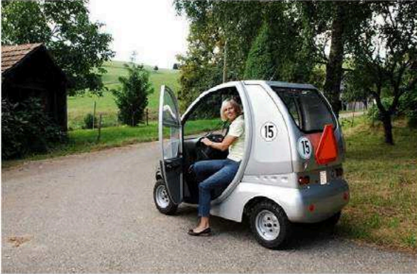
Figuur 2: Een Duits gehandicaptenvoertuig begrensd tot 15 km/uur.

In Duitsland zijn gehandicaptenvoertuigen, waaronder ook gesloten gehandicaptenvoertuigen, begrensd tot 15 km/uur. Dit is zichtbaar gemaakt met een sticker zoals te zien is op onderstaande foto. Het voertuig is een éénzitter met een maximale breedte van 1,10 meter.