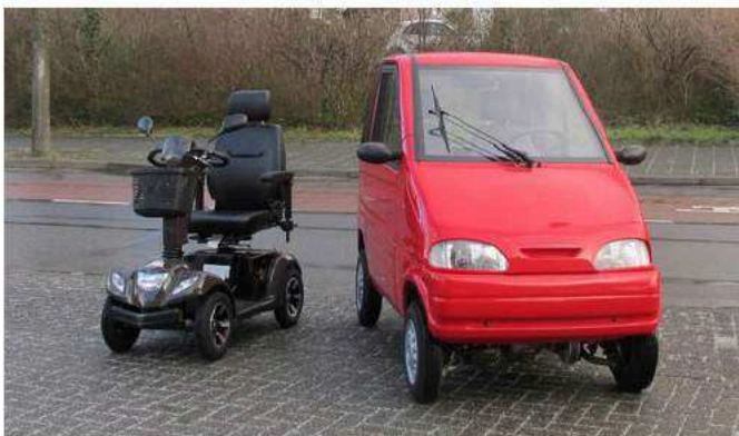
Figuur 1: Links een scootmobiel en rechts een gehandicaptenvoertuig met gesloten carrosserie.

Een voorbeeld van een gesloten gehandicaptenvoertuig is de Canta, rechts in onderstaande afbeelding (SWOV, 2018).