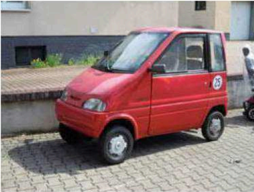
Figuur 4: De zogenoemde '25er', een Duits gehandicaptenvoertuig dat op de weg is gebracht voor 1999. Bron: EG autos (2022) 4

In Oostenrijk bestaat het Führerscheingegesetzes (FSG). Dit is de rijbewijswet waarin bepaald wordt welke personen de weg mogen betreden. Gehandicaptenvoertuigen worden hier net als in het Oostenrijkse StVO niet genoemd. In Oostenrijk geldt wel dat men geen rijbewijs nodig heeft voor elektrische scooters met een ontwerpsnelheid van maximaal 25 km/uur en een maximum vermogen onder de 600 Watt (Oesterreich, 2022). Onder deze elektrische scooters vallen ook enkele elektrische scootmobielen. Ook heeft men in Oostenrijk geen rijbewijs nodig voor voertuigen met een snelheid tot 10 km/uur. Deze voertuigen zijn vrijgesteld van de rijbewijswet (FSG, §1). Wel geldt hiervoor een minimale leeftijd van 16 jaar (FSG, §1.5). Voor voertuigen met een snelheid hoger dan 10 km/uur is wel een rijbewijs en het dragen van een helm verplicht. Gehandicaptenvoertuigen met een gesloten carrosserie zijn niet in de Oostenrijkse wetgeving opgenomen (FSG). Er worden daardoor ook geen speciale eisen genoemd voor gehandicaptenvoertuigen met een gesloten carrosserie (FSG).