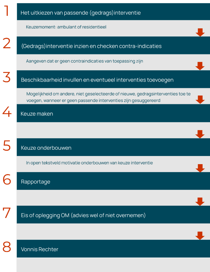
Figuur 1.3 Stappen in het proces van LIJ suggestie voor tot opleggen van een gedragsinterventie

In de handleiding van het LIJ is aangegeven dat na het invullen van de Ritax B het ARR, het DRP en de risicoscores op de domeinen bekend zijn. Dan is de vraag aan de orde of de jongere in aanmerking komt voor één of meerdere gedragsinterventies, vormen van (jeugd)reclasseringstoezicht en/of de gedragsbeïnvloedende maatregel. Zoals eerder gezegd maakt het LIJ een match tussen de jongere en de inclusiecriteria van de (gedrags)interventies. De raadsadviseur checkt vervolgens op eventuele contra-indicaties. Hieronder worden de stappen van de systematiek toegelicht zoals die beschreven zijn in de handleiding van het LIJ. In figuur 1.3 hieronder geven we een schematische weergave van de stappen.