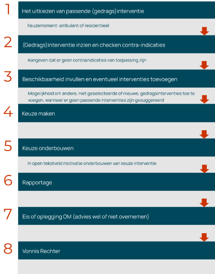
Figuur 1 Stappen in het proces van LIJ tot aan het opleggen van een gedragsinterventie

Om tot een passend advies te komen op basis van de suggesties van het LIJ doorloopt de raadsonderzoeker een zestal stappen die in de onderstaande figuur worden samengevat. In stap 7 neemt de officier van justitie het advies van de RvdK al dan niet over en in stap 8 volgt de rechter al dan niet de vordering van het OM.