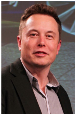
Voorgestelde meeting met: Elon Musk, CEO

Born in South Africa in 1971, Elon Musk became a multimillionaire in his late 20s when he sold his start-up company, Zip2, to a division of Compaq Computers. He achieved more success by founding X.com in 1999, SpaceX in 2002 and Tesla Motors in 2003. Musk made headlines in May 2012 when SpaceX launched a rocket that would send the first commercial vehicle to the International Space Station.