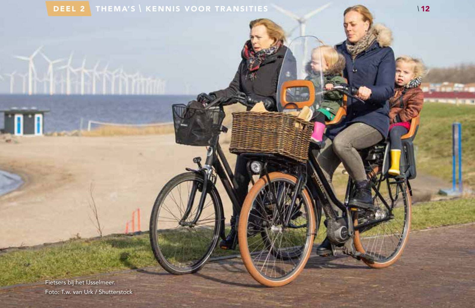
Fietsers bij het IJsselmeer.