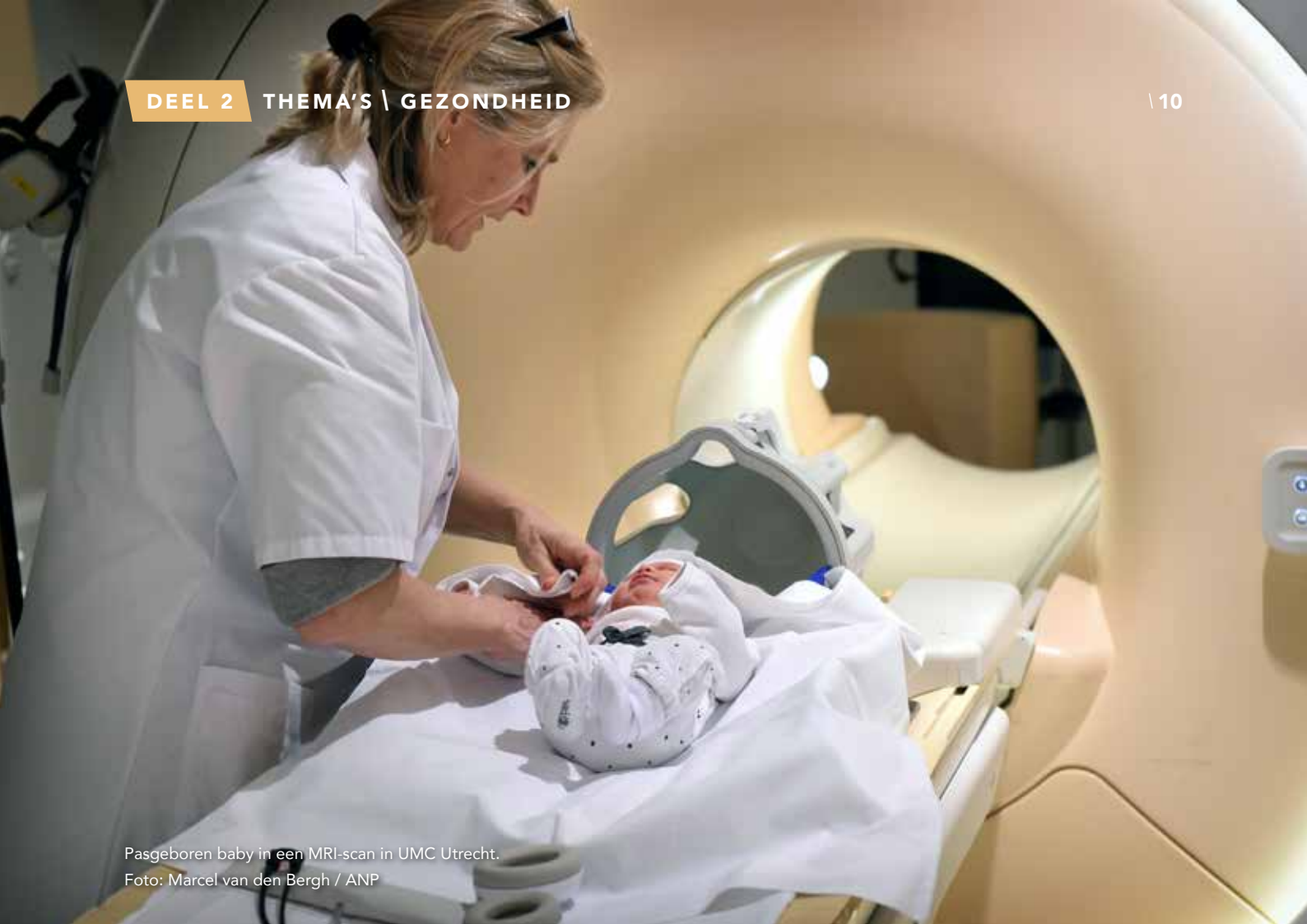
Pasgeboren baby in een MRI-scan in UMC Utrecht.