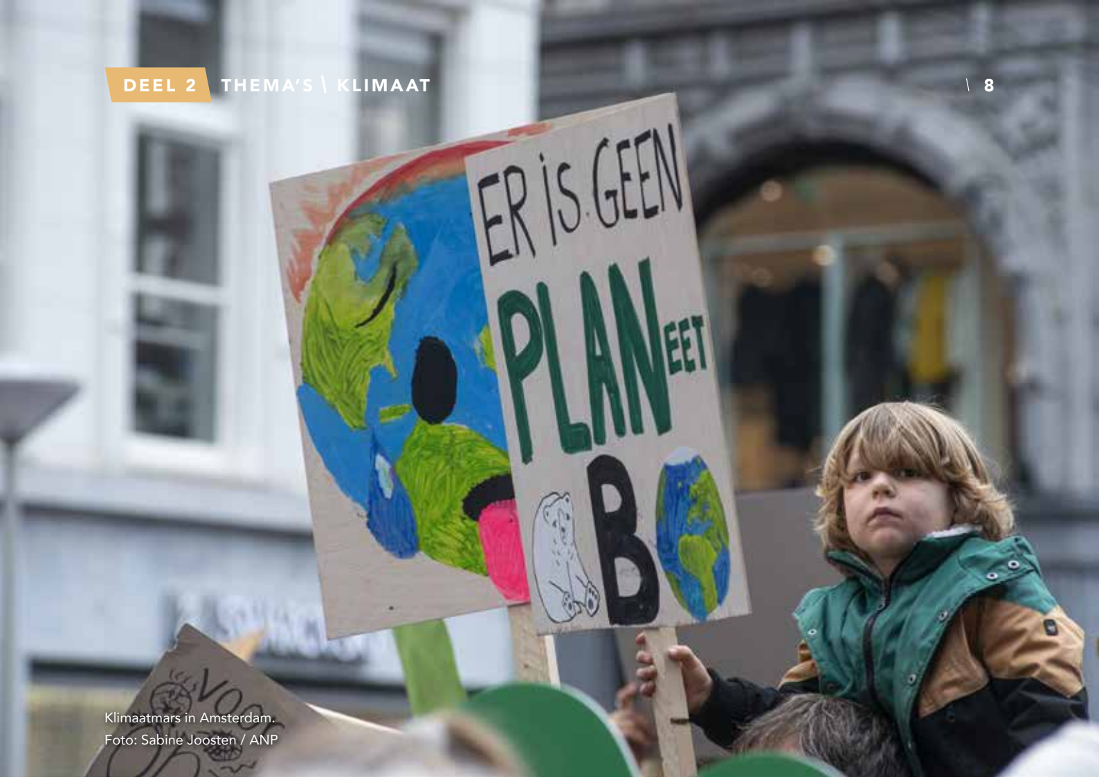
Klimaatmars in Amsterdam.