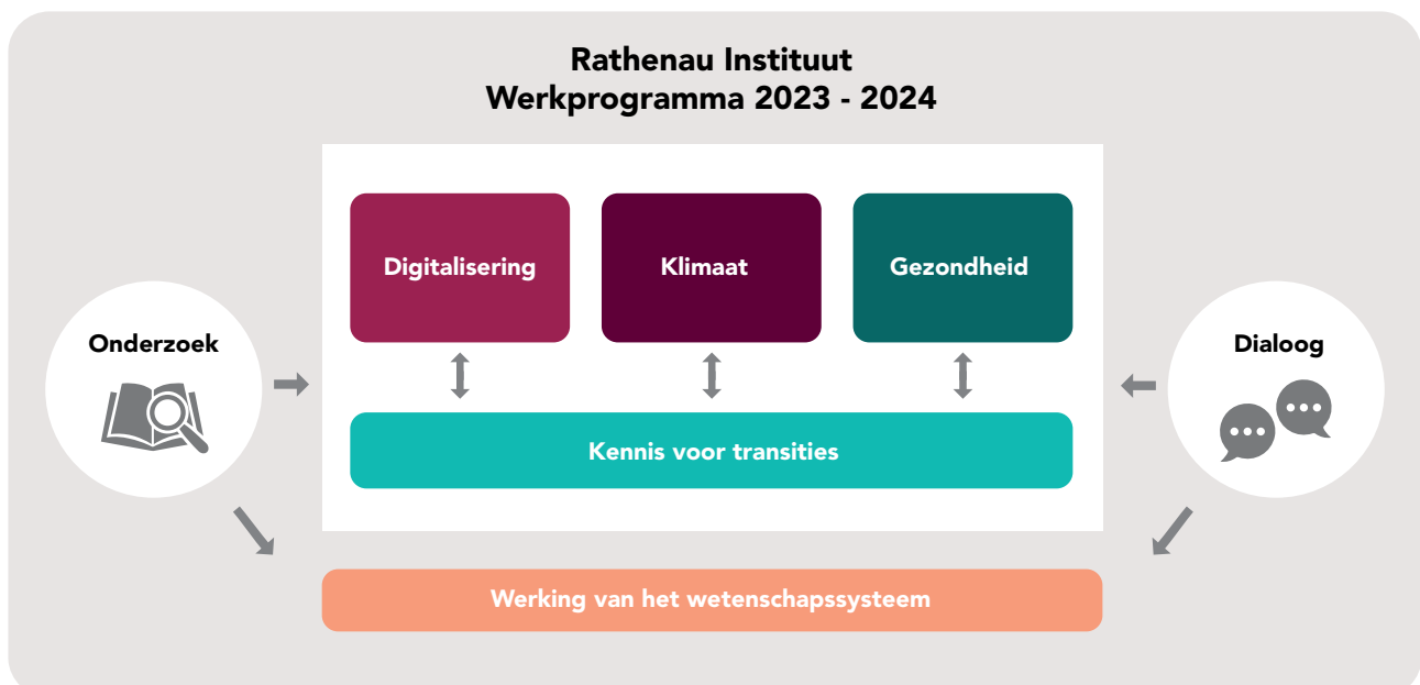
Figuur 1: Schematisch overzicht van het werkprogramma

We zetten daarnaast in op het thema Klimaat , omdat klimaatverandering belangrijke transities noodzakelijk maakt: hoe kunnen we ons voedselstelsel, ons energienetwerk en onze industrie vormgeven binnen de grenzen van de planeet?