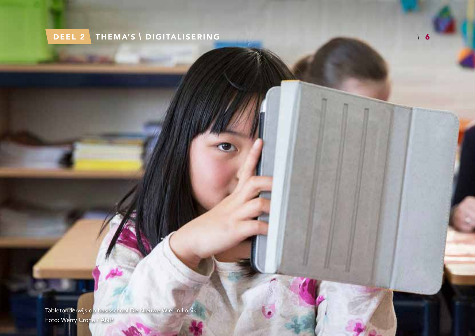
Tabletonderwijs op basisschool De Nieuwe Wiel in Lopik.