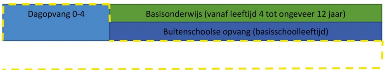
Figuur 1 Aansluiting kinderopvangstelsel en primair onderwijs

In het wetsvoorstel wordt de aansluiting tussen het kinderopvangstelsel en het primair onderwijs langs vier lijnen gecreëerd: de taal, het tweemaal jaarlijks overleg, een doorlopende lijn van voor- naar vroegschoolse educatie, en een goede overdracht tussen kinderopvang en de basisschool. In onderstaande alinea's worden deze lijnen nader toegelicht.