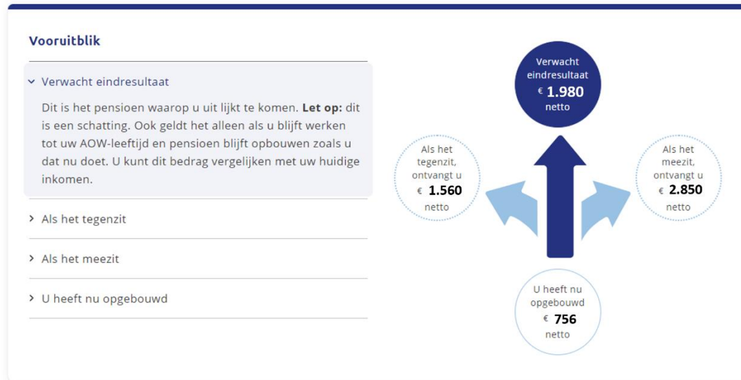
Voorbeeld navigatiemetafoor op MijnPensioenoverzicht.nl