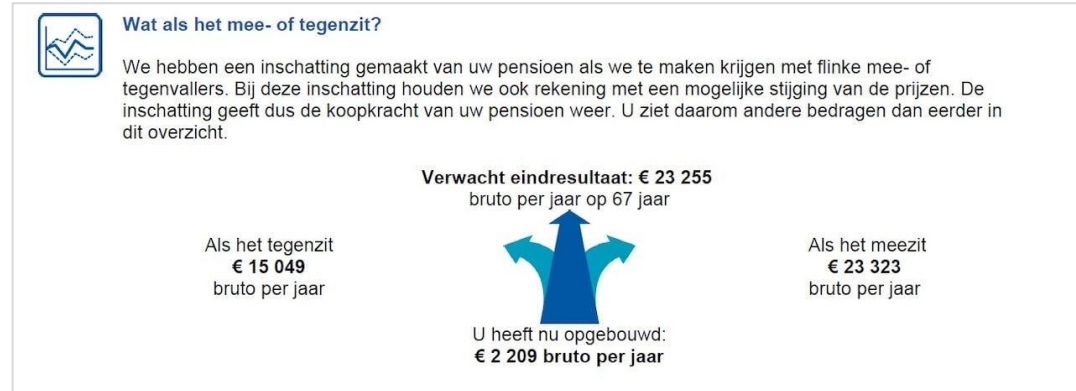
Voorbeeld navigatiemetafoor in UPO van ABP