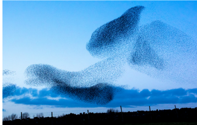
Figuur 3 Zwerm

Het is een vraag die meer mensen bezighoudt. Biologen onderzoeken al lange tijd het complexe fenomeen van zwermgedrag . Eén van de verklaringen van hoe het kan dat zulke grote groepen vogels naadloos samen vliegen zonder dat er een formatie of leider is, is dat de vogels elkaar voortdurend in de gaten houden en hun gedrag aanpassen op elkaar. Om precies te zijn: één individuele vogel houdt tot zeven buurvogels in de gaten. Als er dan één vogel van koers verandert, bewegen de omringende vogels onmiddellijk mee en zo verspreiden bewegingen zich razendsnel door de wolk. In een zwerm kunnen tot wel 750.000 vogels (!) zitten. Zonder vormen van hiërarchische sturing bereiken ze belangrijke gezamenlijke doelen, zoals de verplaatsing van plek naar plek en de bescherming van de groep tegen aanvallers. Zwermgedrag wordt daarom ook wel ‘collectieve intelligentie’ genoemd.