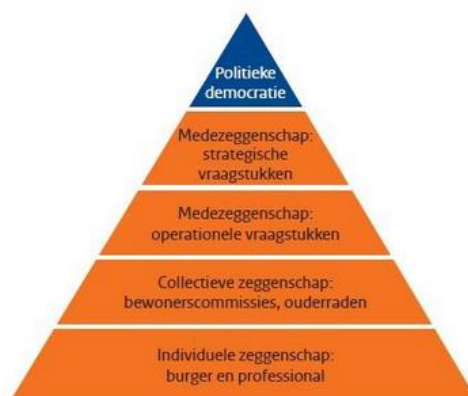
Figuur 3.2 Democratische piramide

Bron: Raad voor het Openbaar Bestuur (2017). Democratie is méér dan politiek alleen – burgers aan het roer in hun leefwereld.