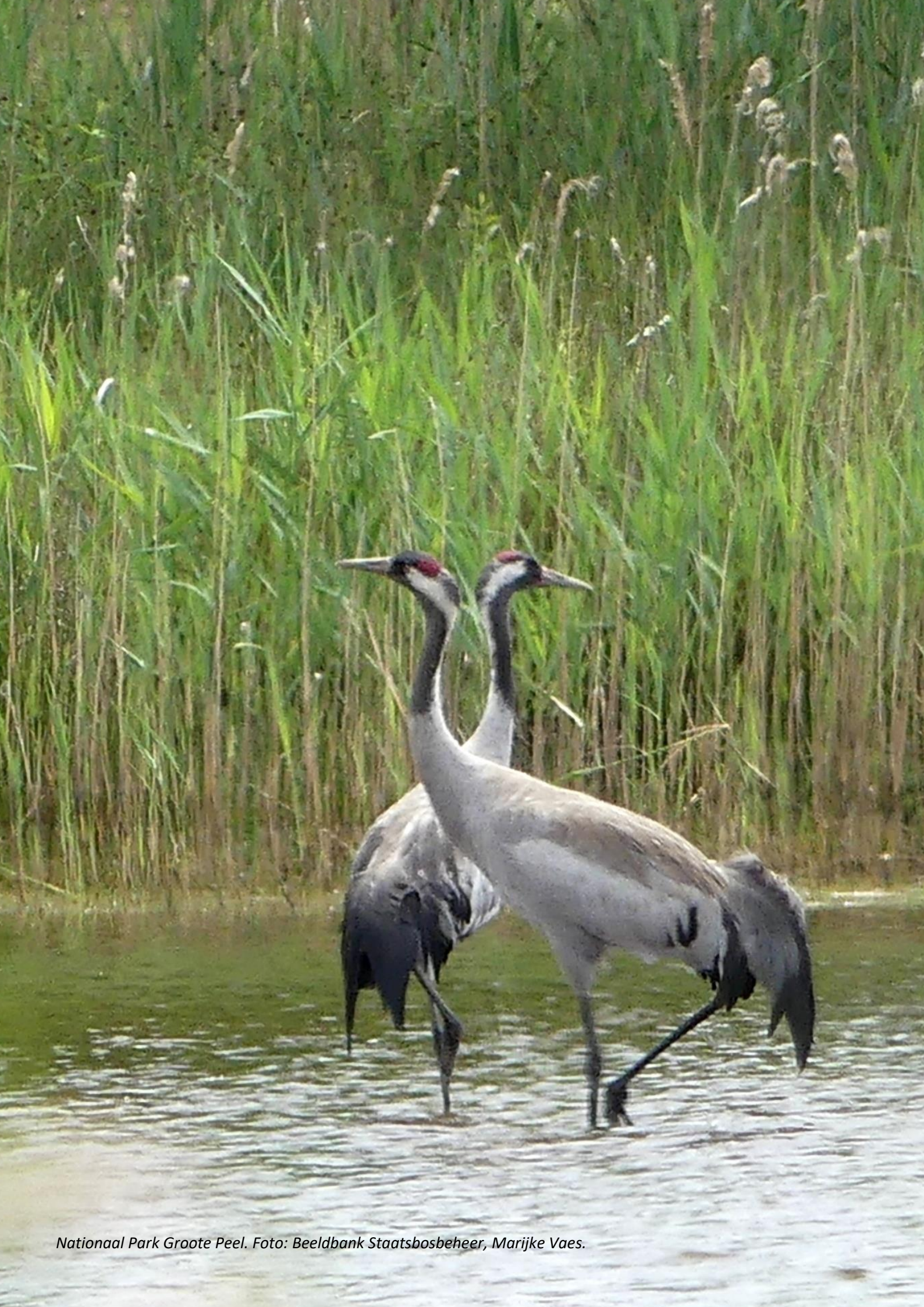
Nationaal Park Groote Peel.