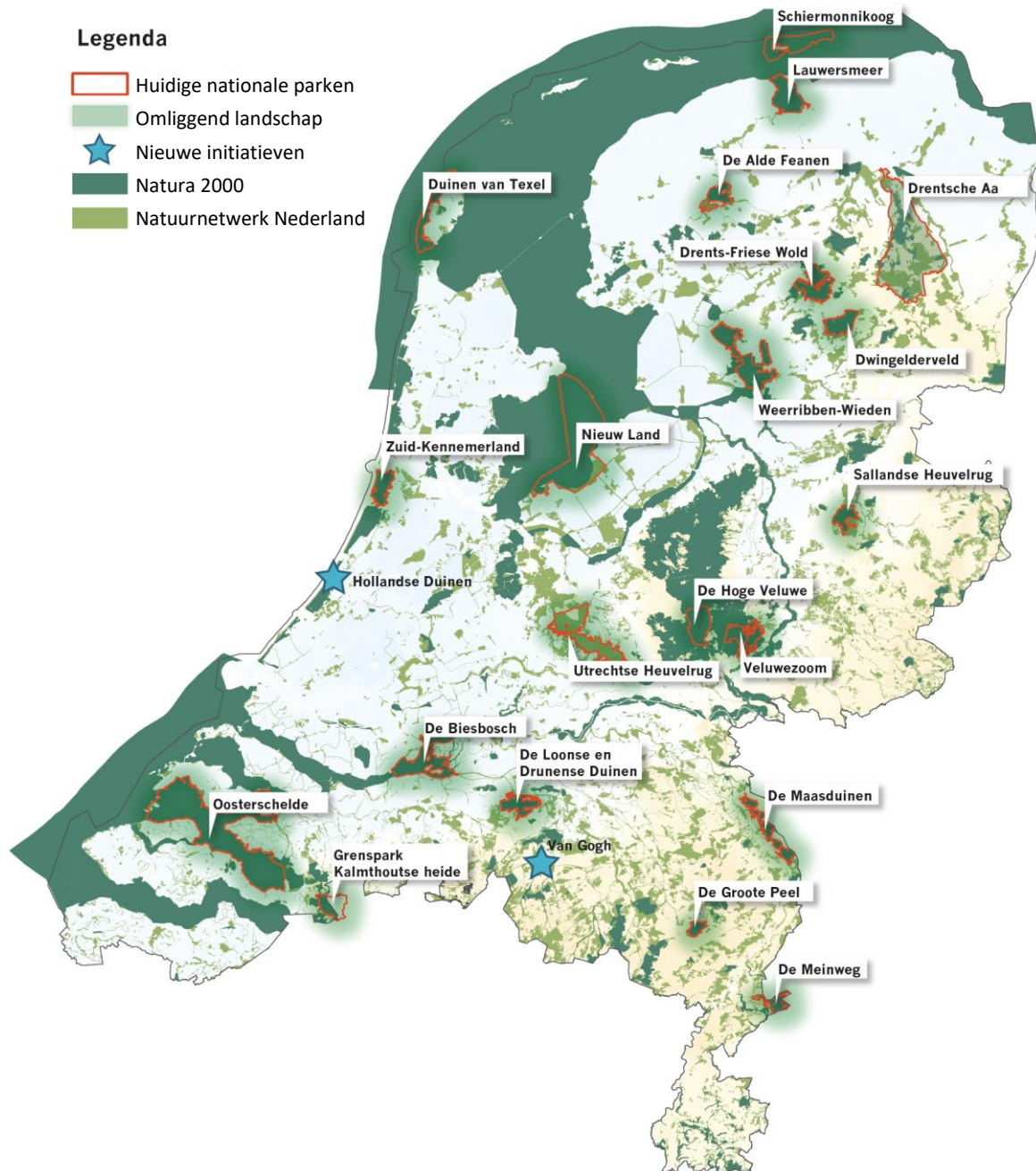
Figuur 1. De nationale parken op kaart: 21 bestaande parken en 2 initiatieven die een statusaanvraag hebben ingediend 5 . Op deze kaart is voor Nationaal Park Drentsche Aa de aangevraagde begrenzing aangegeven (zie pagina 18).