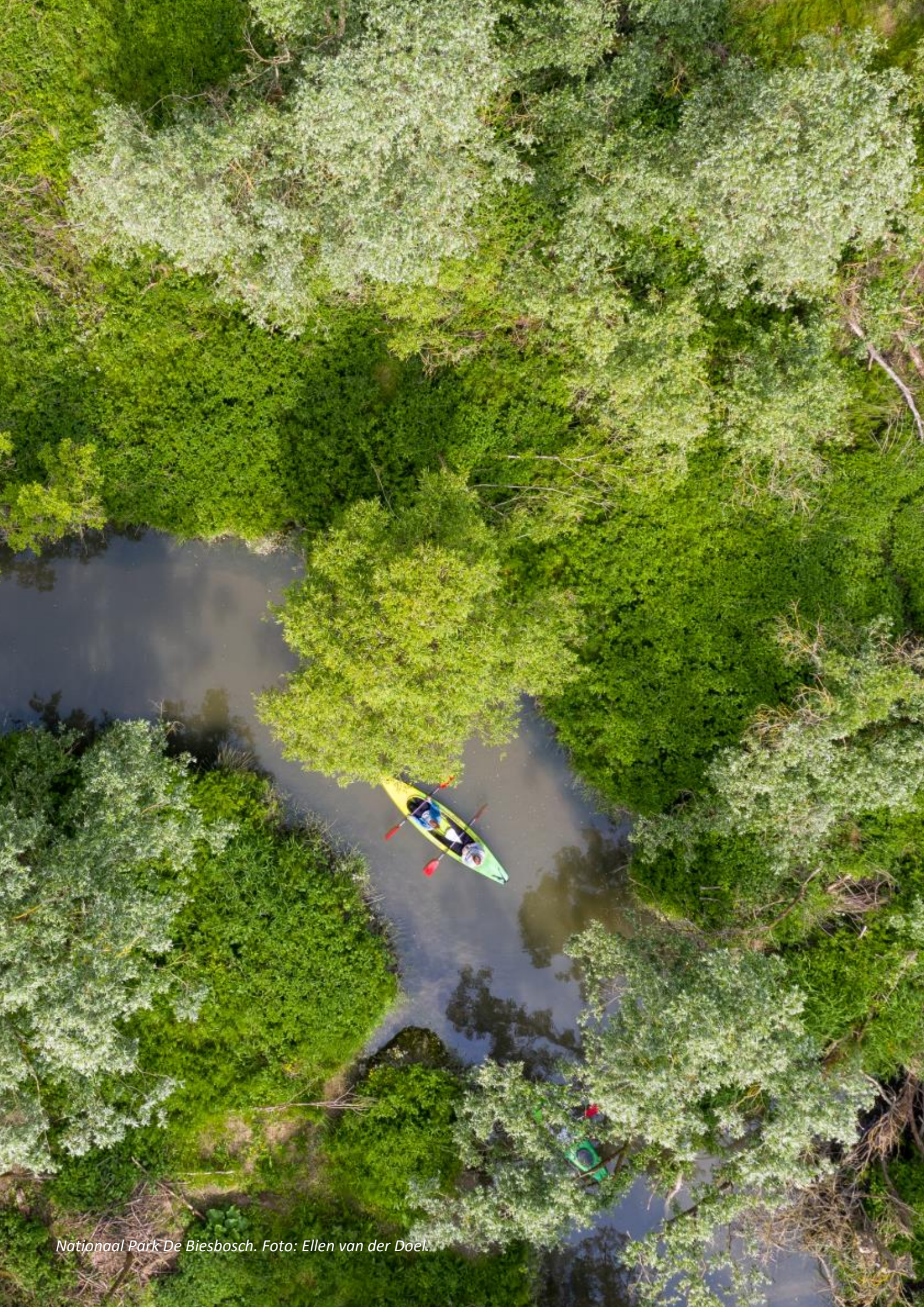
Nationaal Park De Biesbosch.