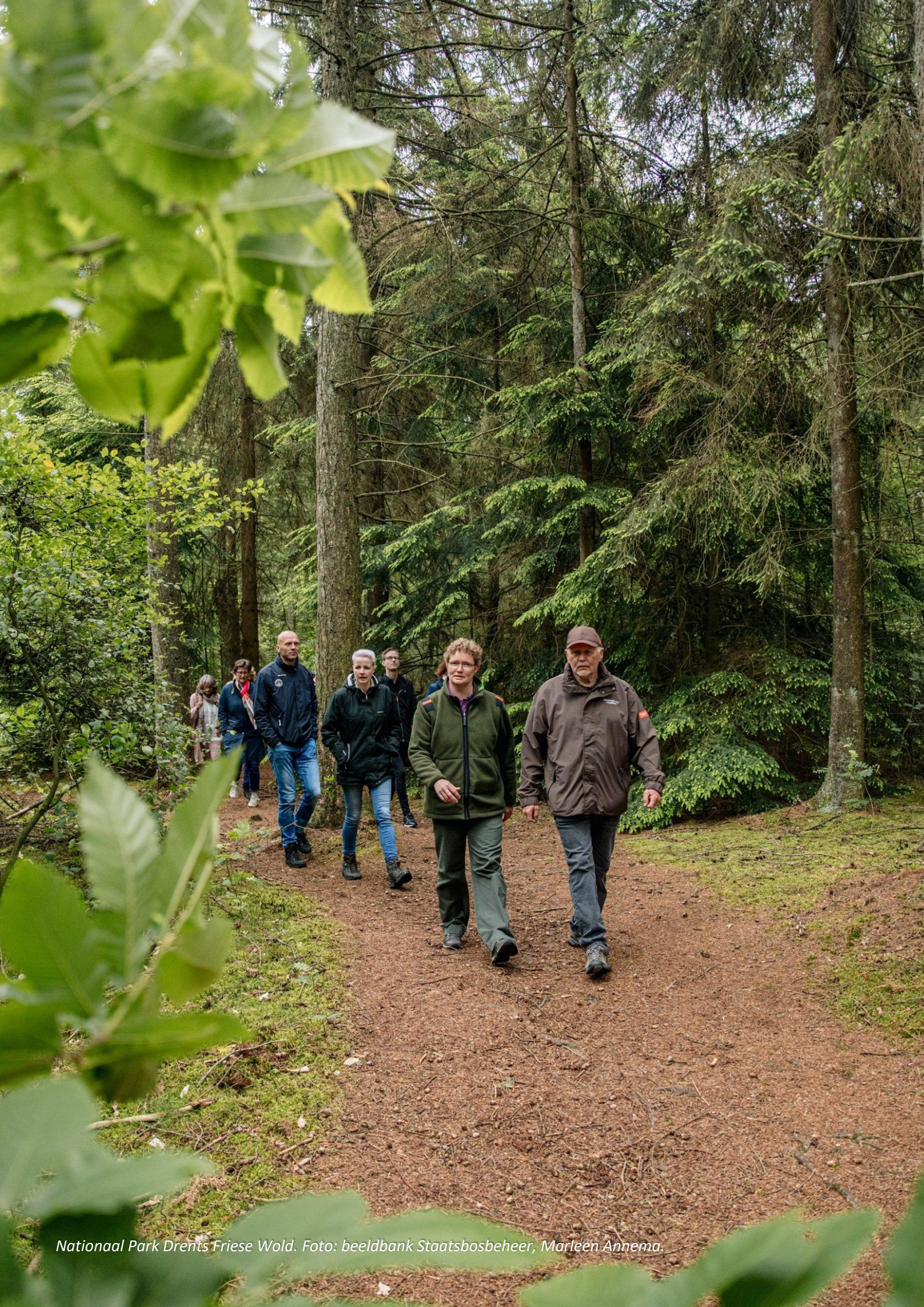
Nationaal Park Drents Friese Wold.