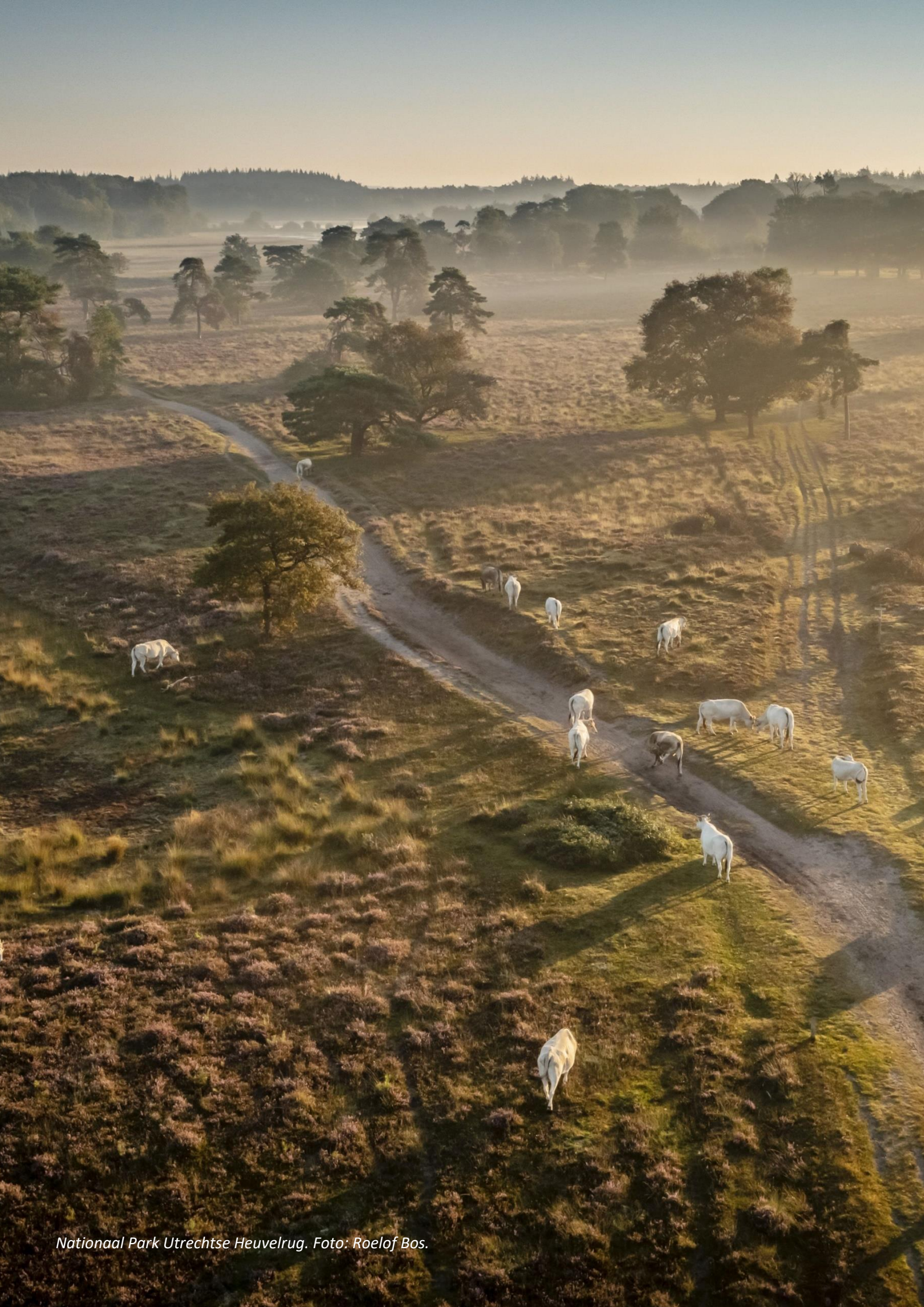
Nationaal Park Utrechtse Heuvelrug.