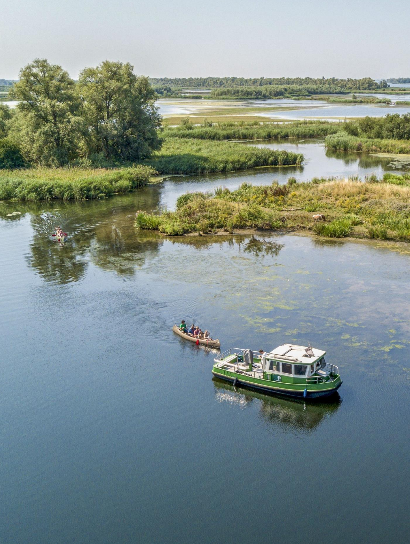
Nationaal Park De Biesbosch.