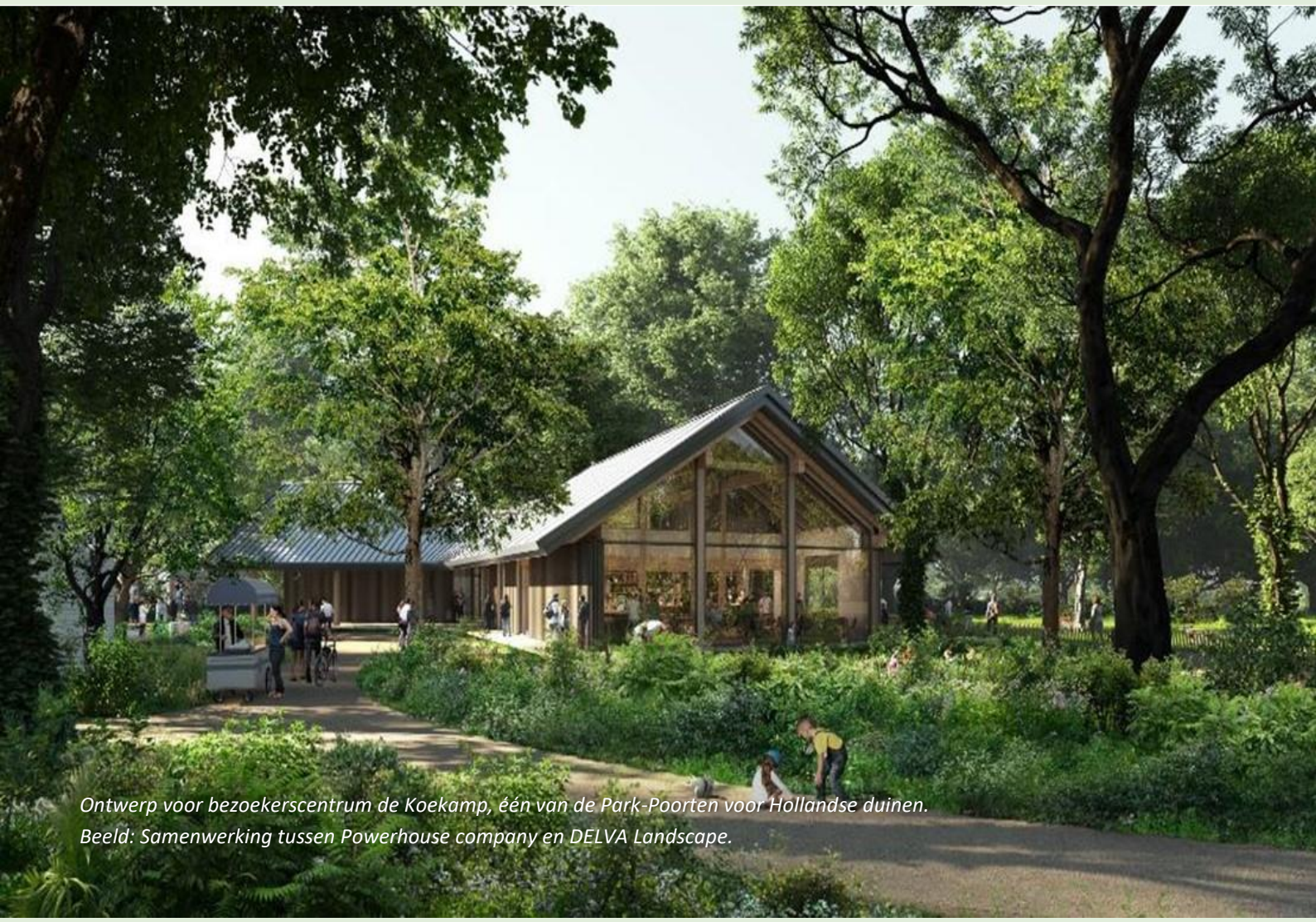
Ontwerp voor bezoekerscentrum de Koekamp, één van de Park-Poorten voor Hollandse duinen. Beeld: Samenwerking tussen Powerhouse company en DELVA Landscape.

Het gebied Hollandse Duinen in de Randstad, waarvoor de status nationaal park is aangevraagd, is uniek: er leven meer dan 7000 planten- en diersoorten en er wonen 1,2 miljoen mensen. Het gebied verwelkomt bezoekers, zodat mensen ervan kunnen genieten en de natuur gaan waarderen. Maar wat als de bezoekersstromen zo groot worden dat negatieve gevolgen voor natuur, landschap en beleving dreigen?