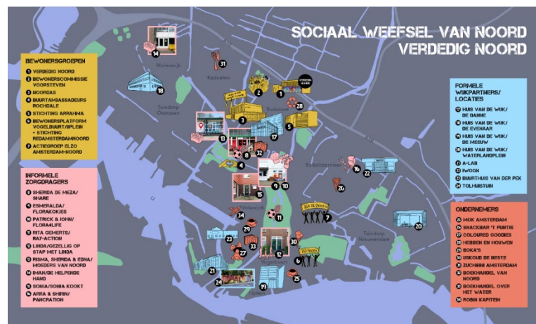
Figuur 2: Voorbeeld van een 'sociale infrastructuur', bestaande uit zowel informele als formele plekken, in dit geval van Amsterdam Noord.

Een architect die het altijd heeft over het belang van contact en interactie, is Herman Hertzberger. Sinds het begin van zijn loopbaan probeert hij ruimtelijke condities te scheppen voor de basale behoefte aan contact. Zijn bekendste ontwerp vondst is de tribunetrap, waarop je kunt zitten, werken en kletsen. Ook iemand als Jan Gehl heeft vanuit die invalshoek pleidooien gehouden voor 'levendige plinten' bij hoogbouw en het idee om steden vooral 'op ooghoogte' te ontwerpen.