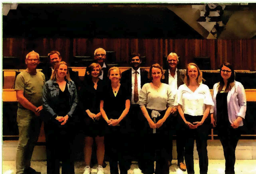
Bezoek aan Südtiroler parlement, met vice-president en FUEN-bestuurslid Daniel Alfreider (Südtiroler Volkspartei).

Bestuur en staf van DINGtiid, voor de gelegenheid aangevuld met een externe onderzoeker, hebben in het kader van het adviesdossier 'Fries in de voorschoolse fase' van 29 mei tot en met 1 juni 2022 een studiereis gemaakt naar Zuid-Tirol, Italië. In die regio wordt Italiaans, Duits en Ladinisch gebruikt en onderwezen. Het belangrijkste doel van de studiereis was om informatie op te halen over hoe meertaligheid in de gemeenschap leeft en fungeert – met nadruk op de voorschoolse fase – en hoe dat op politiek en onderwijskundig gebied handen en voeten krijgt.