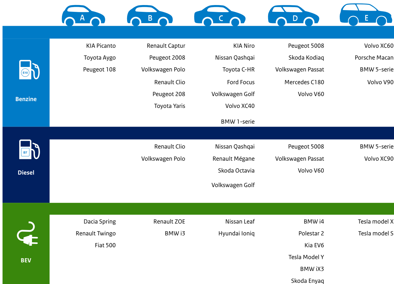
Tabel 1: Voorbeeldauto's per segment

en meetbare benadering voor het indelen van voertuigen in segmenten en sluit, op enkele uitzonderingen na, goed aan bij de auto's die de markt (zowel consumenten als producenten) herkent als typisch voor het betreffende segment. De totale markt is ingedeeld in de segmenten A tot en met E (A=klein, B=compact, C=kleine middenklasse, D=grote middenklasse, E=groot, luxe en duur). Deze segmentindeling wordt tevens gebruikt door de Rijksdienst voor Ondernemend Nederland (RVO) en het Ministerie van IenW om marktontwikkelingen te monitoren, beleidseffecten te evalueren en verschillen tussen vergelijkbare brandstofauto's en nulmissie auto's te kunnen analyseren. Belangrijke voertuig- en kostenkenmerken die als input dienen voor TCO-berekeningen kunnen op het bovengenoemde niveau 1 gebaseerd worden op verkooptgemiddelden van de totale nieuwverkoop per segment of op basis van "mandjes" van geselecteerde auto's die representatief zijn voor een segment. In de tabel hieronder staan een aantal voorbeeldauto's per segment.