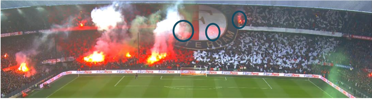
Figuur 4 Ongeveer hetzelfde moment als Figuur 2 en 3 uit een ander perspectief. Feyenoordvlag met meerdere fakkels eronder (omcirkeld) en eromheen, inclusief rookontwikkeling.

Op de bewakingsbeelden (specifiek 012 Gerard Meijer) is vlak voor de aftrap ook duidelijk te horen dat er 'Joden gaan eraan olé olé' gezongen wordt.