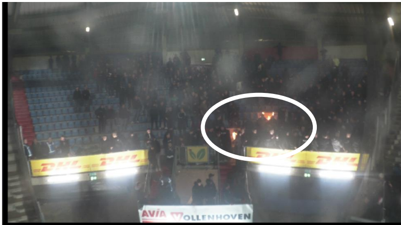
Figuur 17 Still van bewakingsbeelden van Willem II met omcirkeld waar de brand zichtbaar is.

Beide voorbeelden zijn niet hetzelfde als de in dit onderzoek belichte wedstrijd Feyenoord – Ajax, omdat bij Ajax – Feyenoord (maart 2022) de trappen (redelijk) leeg waren en omdat bij Willem II – FC Den Bosch het vak veel leger was en er geen vlag, maar stoeltjes brand hadden gevat.