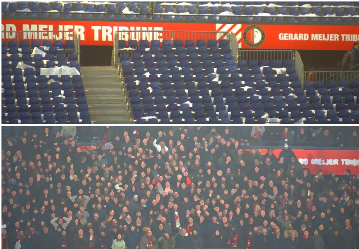
Figuur 9 en 10. Screenshots van dezelfde positie op de Gerard Meijer Tribune, zonder en met (geanonimiseerd) publiek, waarop duidelijk te zien is dat de trap niet vrijgehouden wordt.

Er wordt iemand naar de rode trap toegestuurd om door te geven dat mensen niet op de trap mogen staan. Uit documentatie die na de wedstrijd is opgesteld, blijkt dat het publiek in de sectoren groen en wit boos is vanwege de overvolle vakken 13 .