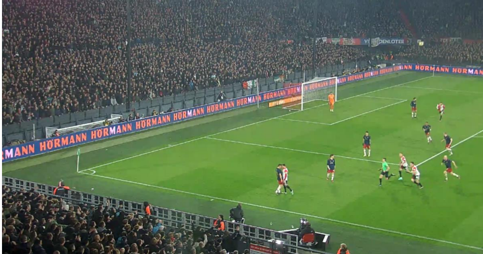
Figuur 11 Opstootje Orkun Kökcü en de Ajacied Dušan Tadić.

aanvoerders van beide ploegen, de Feyenoorder Orkun Kökcü en de Ajacied Dušan Tadić (Figuren 11-15). Dit opstootje lijkt te zijn ontstaan vanwege provocatie op het veld. Als reactie hierop wordt er vanaf de tribune (rond vak Z 4) bier gegooid richting de spelers die betrokken zijn bij het opstootje. Meerdere supporters gooien vanaf de tribune spullen richting de spelers, waarbij Ajacied Davy Klaassen op zijn achterhoofd wordt geraakt door een aansteker. Als gevolg hiervan zakt hij naar de grond. Als hij opstaat is op zijn hoofd duidelijk een bloedende wond zichtbaar. Enkele spelers maken hierna sussende gebaren richting de supporters. De wedstrijd wordt tijdelijk gestaakt en de spelers verlaten het veld.