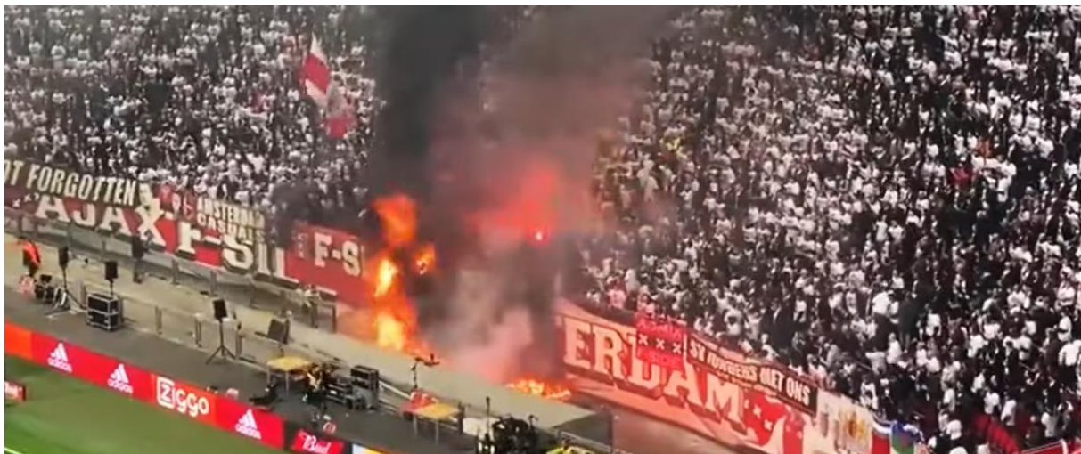
Figuur 16 Still van YouTube waar de brand bij de wedstrijd duidelijk zichtbaar is.