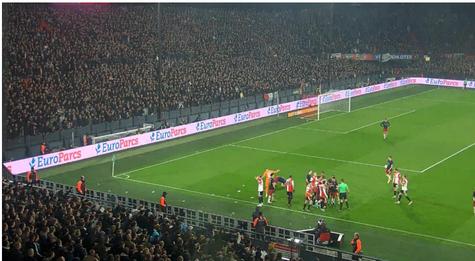
Figuur 13 het moment dat Davy Klaassen geraakt wordt door een aanstecker.