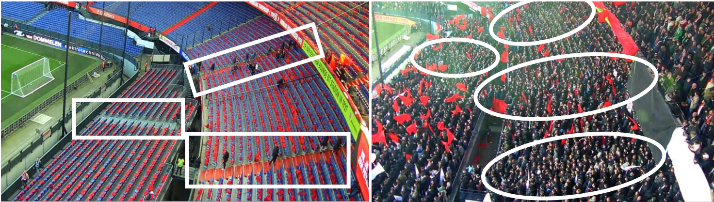
Figuur 7 en 8 Beeld van de lege Gerard Meijer Tribune en tijdens de wedstrijd. Omcirkeld zijn de locaties van de trappen. De figuur rechts geeft een iets grotere hoek weer. De drie bovenste cirkels zijn ook op de figuur links terug te zien in een rechthoek.