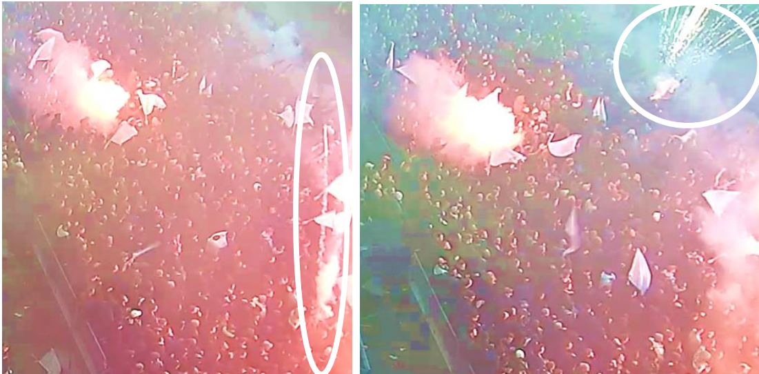
Figuur 5 en 6 Het moment van de aftrap waarbij projectielen afgeschoten worden (omcirkeld) vanuit vak X. In totaal gaat het om ongeveer 12 keer.

Twee minuten na 20.00 uur gaat de wedstrijd van start. Direct na de aftrap van de wedstrijd wordt voor een tweede keer veel vuurwerk afgestoken. Dit keer ook met projectielen, maar het soort vuurwerk is vanaf de beelden niet vast te stellen. Er ontstaat een zwarte rookwolk, voornamelijk boven vak X1 en X2, die zo groot is dat de wedstrijd wordt stilgelegd door de arbiter.