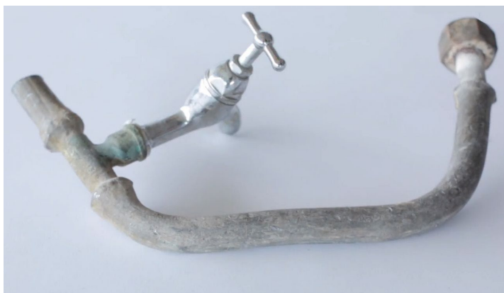
Figuur 3: Loden leiding

Op 2 juli 2020 hebben de ministers van Binnenlandse Zaken en Koninkrijksrelaties, Infrastructuur en Waterstaat en van Medische Zorg in een gezamenlijke brief de Tweede Kamer verder geïnformeerd over welke acties er tot dan toe samen met diverse betrokkenen zijn ingezet en wat de (vervolg)aanpak inhoudt. In deze brief is voor de monitoring van lood in drinkwater onder meer aangegeven dat de reguliere monitoring door de drinkwaterbedrijven ook in de toekomst gebruikt wordt voor een globaal inzicht in de verdere ontwikkeling van de aanwezigheid van lood in drinkwater. De analyse van de individuele loodmetingen in de distributiegebieden van de drinkwaterbedrijven is daarom in de vorige rapportages uitgebreid met de metingen van 2019 tot en met 2021. In deze rapportage zijn ook de metingen van 2022 toegevoegd.