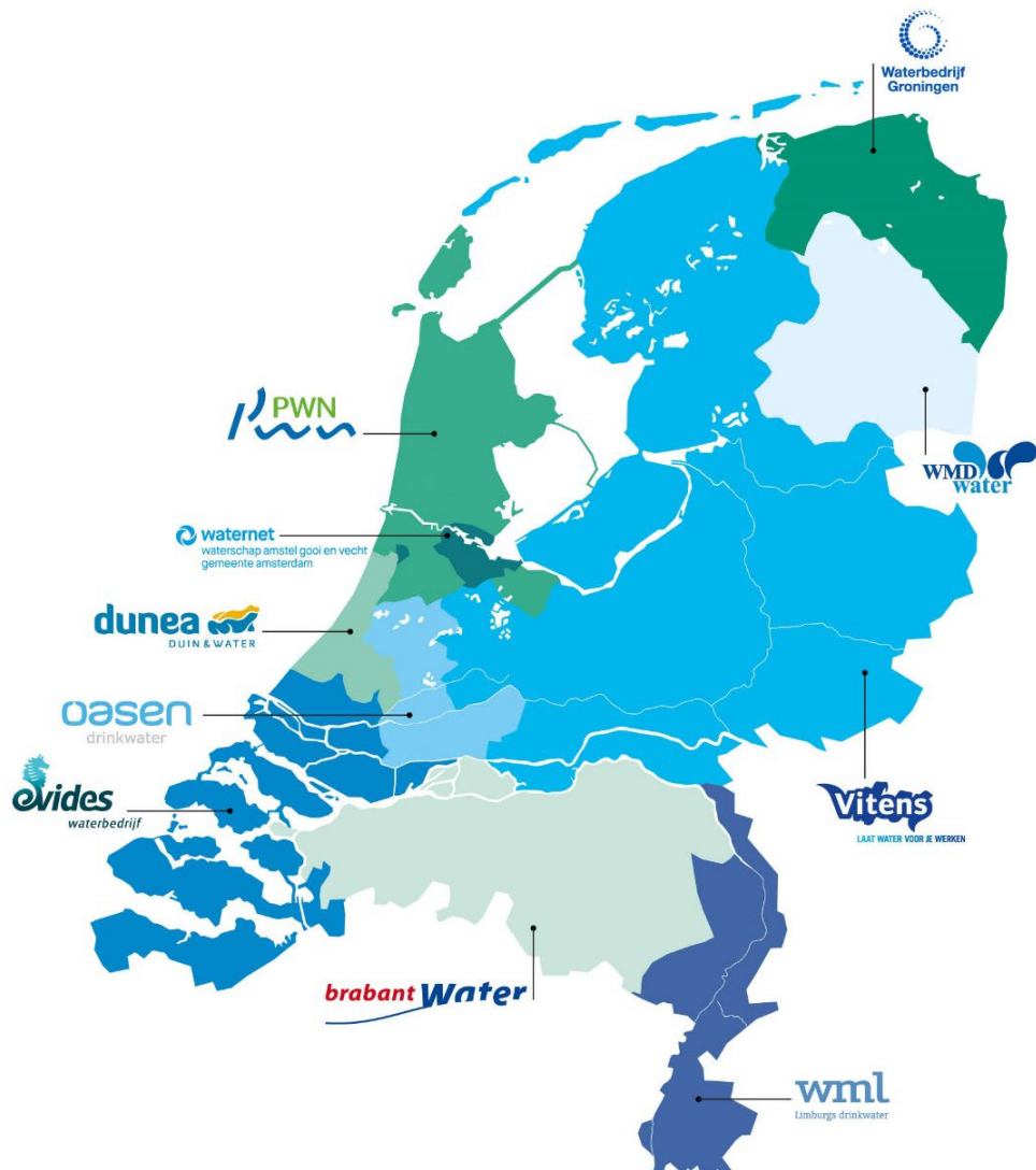
Figuur 1: Distributiegebieden van Nederlandse drinkwaterbedrijven