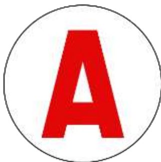
Figuur 2: A-sticker

"Bestuurders die minder dan een jaar in het bezit zijn van een rijbewijs moeten, ongeacht de andere snelheidsbeperkingen die zijn vastgesteld in toepassing van deze code, een snelheid van 90 kilometer per uur niet overschrijden. Deze maximumsnelheid moet, onder de voorwaarden bepaald bij de besluiten van de Minister van Openbare Werken en Volkshuisvesting en van de Minister van Binnenlandse Zaken, worden aangegeven door middel van een verwijderbare voorziening op elk voertuig dat door de betrokkene wordt bestuurd." (Décret n°69-150 du 5 février 1969 portant règlement d'administration publique modifiant et complétant le code la route)