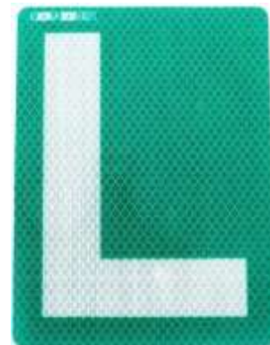
Figuur 6: L-plaat in Spanje

In Spanje is sinds 1960 een dalende trend zichtbaar in het aantal ongevallen. Het aantal dodelijke ongevallen van 9.344 is gedaald naar 1.680 in 1989. In 2019 was het aantal dodelijke ongevallen echter weer gestegen naar 1.755 (Road Safety Strategy 2030, p.15). Enkele belangrijke oorzaken van ongevallen zijn afleiding in het verkeer (onder andere door mobiele apparaten) en rijden onder invloed van alcohol of drugs. Meer dan de helft van de ongevallen (53%) vindt plaats onder de kwetsbare groepen en modaliteiten, zoals voetgangers, fietsers en motorfietsers. Ook ouderen (boven de 65 jaar) komen naar voren als groep waarbinnen verhoudingsgewijs meer ongevallen plaatsvinden. In Spanje zijn beginnende bestuurders (die minder dan een jaar in het bezit zijn van hun rijbewijs) verplicht om een groene plaat met de letter 'L' op de auto te plaatsen (zie figuur 6).