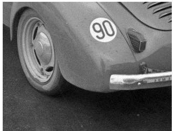
Figuur 1: 90km-sticker

Tussen 1960 en 1970 vond in Frankrijk een enorme toename in de hoeveelheid wegverkeer plaats. Het verkeer is in die periode vermenigvuldigd met een factor 2,3 waardoor ook het aantal ongevallen enorm toenam. Een van de uitgangspunten van het Franse beleid in die jaren was dat snelheid een belangrijke factor vormt bij ongevallen met beginnende bestuurders (volgens het Ministère de l'Intérieur is snelheid nog steeds de voornaamste oorzaak van dodelijke ongelukken in Frankrijk). Sinds 1969 is het voor beginnende bestuurders (wiens rijbewijs minder dan één jaar oud is) niet toegestaan om harder dan 90 km per uur te rijden (Article R.413-5 du code de la route, zie artikel R. 10-2 in onderstaand kader). Om deze reden moesten beginnende bestuurders een '90'-sticker op hun voertuig plaatsen zodat andere bestuurders konden zien dat het betreffende voertuig niet harder dan 90 km per uur mag rijden en zij hun gedrag hierop kunnen aanpassen.