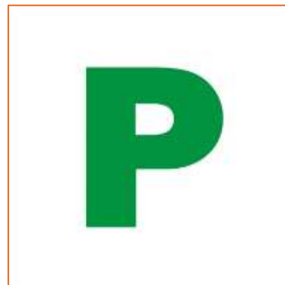
Figuur 4: Voorbeeld van een P-plate

De verschillende constituerende landen van het Verenigd Koninkrijk kunnen zelf hun eigen regelgeving bepalen op het gebied van rijbewijzen en verkeersveiligheid. Voor beginnende bestuurders betekent dit in de praktijk echter dat alleen Noord-Ierland een afwijkend systeem heeft en dat de systemen in Engeland, Schotland en Wales hetzelfde zijn. Voor deze studie is in principe alleen gekeken naar Engeland, andere relevante aspecten uit andere gebieden worden voor de volledigheid echter ook meegenomen. In Engeland moeten beginnende bestuurders (die minder dan een jaar geleden hun rijbewijs gehaald hebben) een witte sticker met de letter 'P' op de auto plaatsen (zie figuur 4).