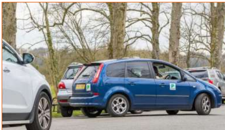
Figuur 5: Voorbeeld van een P-plate