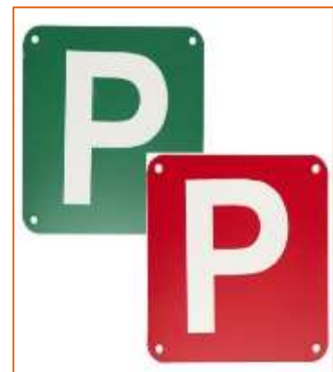
Figuur 10: Voorbeeld van P-plate

Doordat de verschillende Australische jurisdicties hun eigen verkeersregels bepalen, verschilt ook de historie van de aanvullende regels voor beginnende bestuurders. Sinds de jaren '60 krijgen bestuurders die hun rijbewijs behalen in verschillende staten eerst een 'probationary license'. Na een aantal jaar kwam voor deze bestuurders de verplichting erbij om gedurende de 'probationary' periode een plaat met de letter P te voeren op het voertuig dat ze besturen (zie figuur 10). In een aantal staten kwamen daar gedurende de 20 e eeuw aanvullende regels bij met betrekking tot het maximale vermogen dat een voertuig mag hebben of het toegestane alcoholpercentage dat een bestuurder mag hebben.