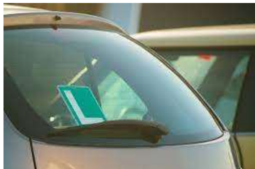
Figuur 7: L-sticker bevestigd op auto

De doelstellingen van het beleid zijn in lijn met de voorstellen van de Verenigde Naties en de Europese Commissie: in 2030 een vermindering van 50% van het aantal dodelijke slachtoffers ten opzichte van 2019 (1.755) en een vermindering van 50% in ernstig letsel in vergelijking met het basisjaar 2019 (8.613, volgens politiegegevens).