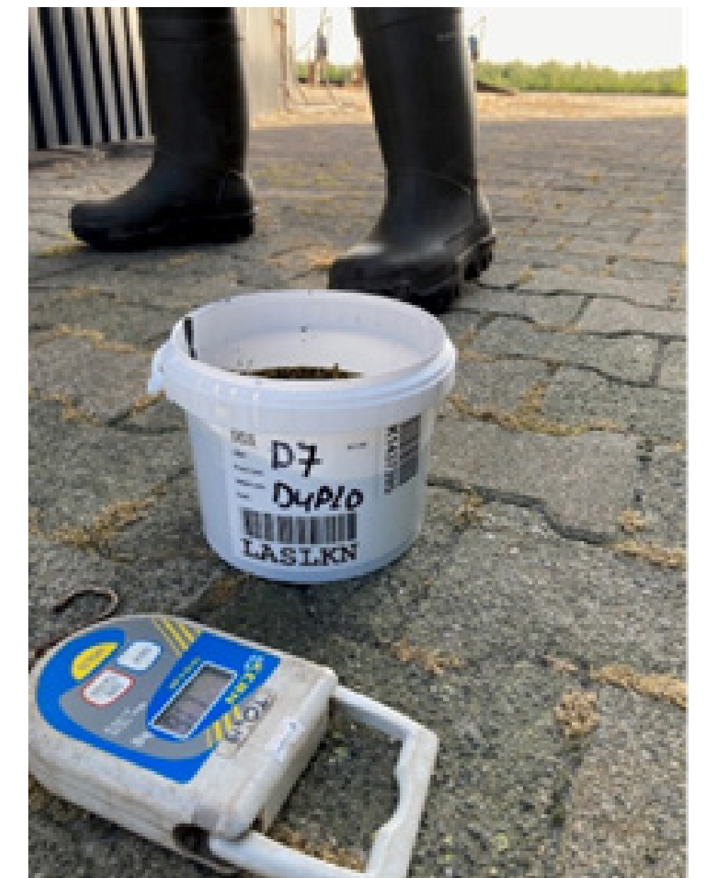
Figuur 1. Voorbeeld van monsterpot

Monsters zoals mest en digestaat dienen te worden voorbehandeld om MDMA, amfetamine en methylamfetamine uit de monsters te kunnen extraheren en vervolgens verder op te zuiveren / concentreren zodat de monsterextracten geschikt zijn voor de instrumentele analytische meting. Het aangeleverde monstermateriaal wordt in eerste instantie gehomogeniseerd en daarna is hiervan een proefeenheid van 2 gram per monster ingewogen. Ten behoeve van de kwaliteitscontrole op de analyse van elk individueel monster zijn aan elk monster de gelabelde interne standaarden MDMA-d5 en amfetamine-d11 toegevoegd. Met behulp van een aangezuurd mengsel van acetonitril en water worden de te bepalen componenten geëxtraheerd uit de monsters. De extracten worden verder opgezuiverd m.b.v. een centrifugestap, gevolgd door een filtratiestap en vervolgens gemeten op een vloeistofchromatograaf gekoppeld aan een tandem massaspectrometrisch systeem (UHPLC-MS/MS) op de aanwezigheid van MDMA, amfetamine en methylamfetamine.