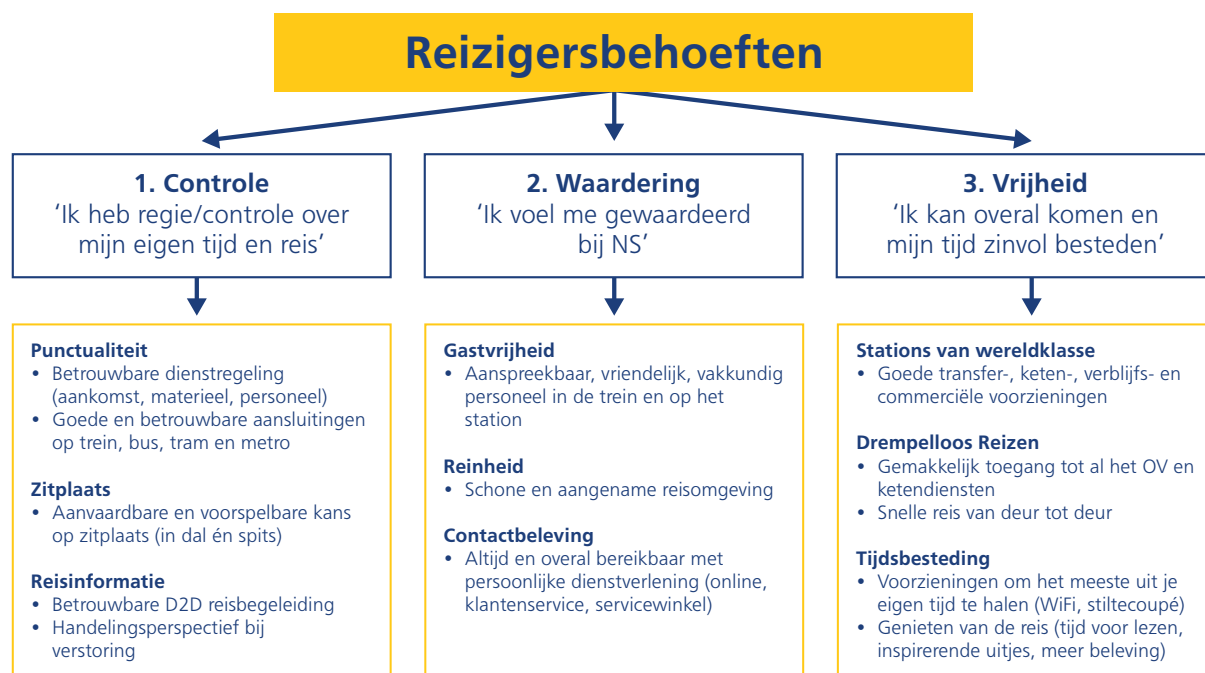
Figuur 1: Onze prestaties op bovenstaande negen thema's beïnvloeden gezamenlijk het Algemeen klantoordeel.

We streven naar zowel betere prestaties op de satisfiers als het op peil houden van het prestatieniveau voor de dissatisfiers . Daarbij zijn keuzes nodig om het spoorvervoer van hoge kwaliteit en betaalbaar te houden. Zo werken we aan het realiseren van de doelstellingen op alle prestatie-indicatoren, waaronder het Algemeen klantoordeel. In de volgende paragrafen zetten we per thema uiteen wat de relatie is met de klanttevredenheid en wat we doen om de tevredenheid van onze reizigers op een hoog niveau te houden.