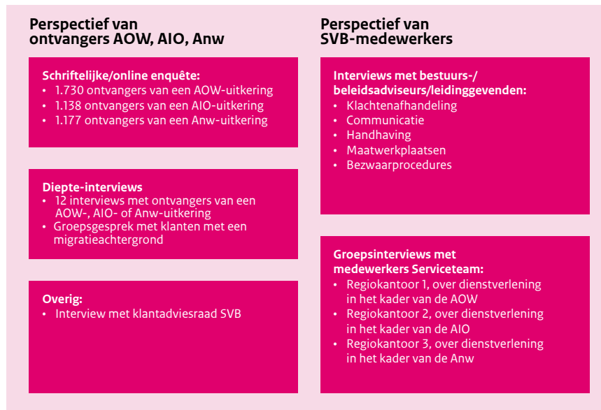
Figuur 2 Methoden van het onderzoek