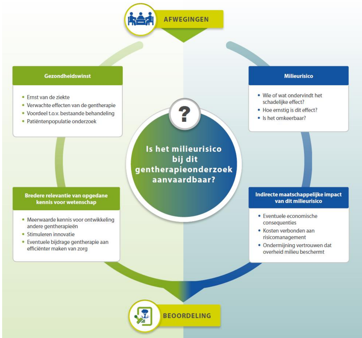
Figuur 2: Overzicht afwegingselementen uit de COGEM-signalering (blz. 37).

In praktische zin vragen de respondenten zich af hoe de voordelen van het onderzoek op een objectieve manier tegen de nadelen afgewogen kunnen worden. Het afwegingskader van de COGEM beoordeelt de aanvaardbaarheid van het milieurisico van een aanvraag voor genterapieonderzoek door de gezondheidswinst en wetenschappelijke relevantie van het onderzoek af te wegen tegen het milieurisico en de indirecte maatschappelijke effecten daarvan (zie figuur 2 uit de COGEM-signalering hieronder). Maar een kosten-batenanalyse is al heel complex als alleen naar de patiënt gekeken wordt, laat staan als de mogelijke gezondheidswinst van patiënten tegen het milieurisico voor de algemene bevolking, dieren en het leefmilieu afgewogen moet worden.