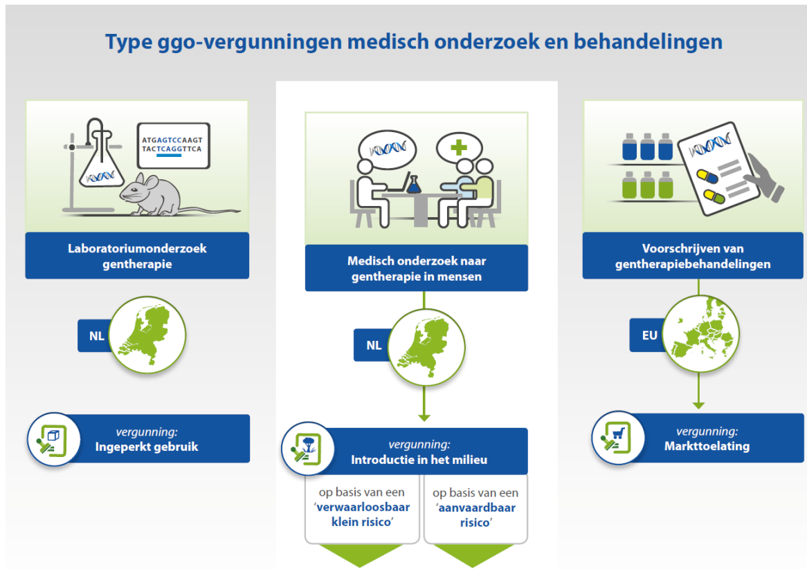
Figuur 1: Voorbeelden van medische ggo-toepassingen en de drie typen vergunningscategorieën die daarbij horen uit de COGEM-signalering (blz. 18)