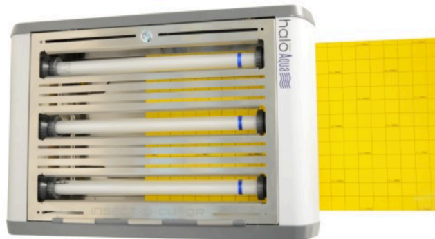
Afbeelding 4: screenshot (30-11-2023) van een vliegenlamp met lijmplaat van het merk en type Insect-O-Cutor Halo Aqua 45W op de website van Edialux, edialux-pro.eu.

Voor vliegende insecten worden verschillende lijmproducten gebruikt. De lijmproducten die het meest werden genoemd tijdens de gesprekken waren lijmplaten in vliegenlampen en lijmplaten voor het monitoren voor kakkerlakken. Middels lijmplaten die in vliegenlampen met Uv-licht worden geplaatst kunnen gevangen insecten makkelijk worden geteld en gedetermineerd. Voorheen werden voor het bestrijden van vliegen elektrocutievallen ingezet. Vanwege bepaalde hygiëneregels mogen deze echter niet meer worden gebruikt, omdat de gedode insecten (in delen) naar beneden vallen en daarmee een risico vormen voor de voedselveiligheid of productveiligheid van bijvoorbeeld farmaceutische producten.