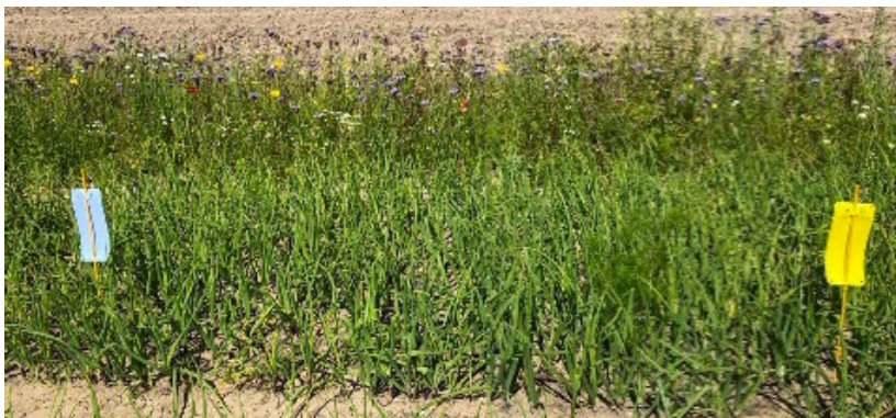
Afbeelding 6: lijmfallen naast een ingezaaide akkerrand voor het monitoren van insecten.

In gecontroleerde omgevingen (bijv. gaasdoekteelt) met aardappelteelt worden de vallen ingezet voor het monitoren van bladluizen. Dit is van belang omdat bladluizen vectoren kunnen zijn van aardappelvirussen die de export van het pootgoed negatief kunnen beïnvloeden. Soms is het ook nodig deze monitoring in het open veld uit te voeren. In dat geval worden in deze toepassingscontext de vallen dagelijks gecontroleerd.