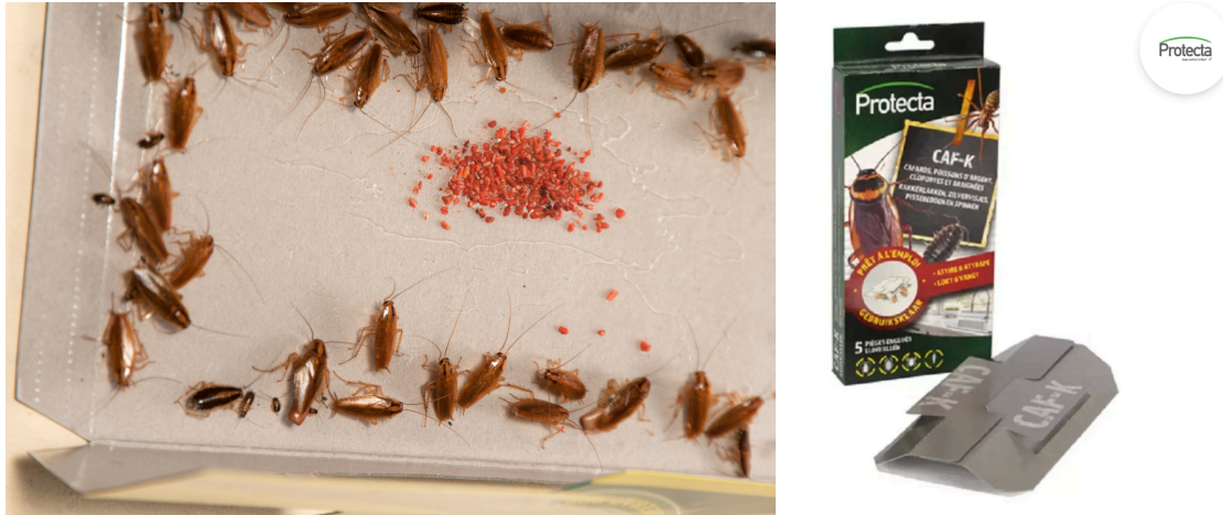
Afbeelding 3a en 3b: kakkerlakken op een lijmplaat met lokaas (links) en een screenshot (30-11-2023) van een Protecta tunnelval voor kakkerlakken (rechts, bron: allestegenongedierte.nl).

Waar lijmplaten regelmatig voor worden ingezet is de monitoring van kakkerlakken. Door de vallen kundig te plaatsen kan in kaart worden gebracht op welke plekken in een pand er hoeveel insecten zijn. De bron van de overlast kan zo worden opgespoord, waarna er een gerichte bestrijding kan plaatvinden met mechanische of chemische middelen.