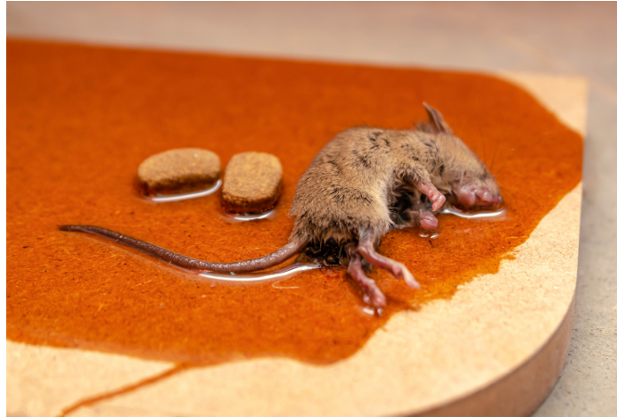
Afbeelding 2: een muis zit vastgeplakt op een houten plaat met lijm.

In het onderzoek van Baker en collega's (2022) werd voor de beoordeling van lijmplaten uitgegaan van een controlefrequentie van ten minste elke 12 uur in overeenstemming met de richtlijnen voor goed gebruik van lijmplaten, die in 2017 zijn opgesteld door de Pest Management Alliance (PMA) in het Verenigd Koninkrijk 23 .