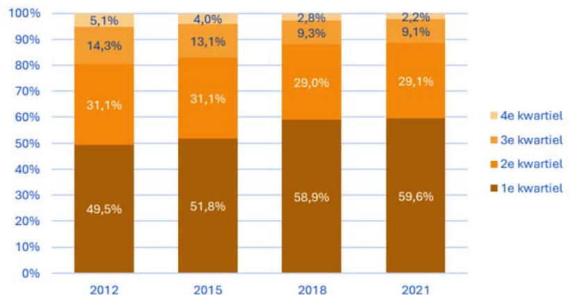
Tabel 2: Bewoners gereguleerde huursector naar inkomenskwartiel.

Dit effect is niet geheel toe te schrijven aan de IAH. Woningcorporaties moeten jaarlijks huishoudens met een lager inkomen (onder de inkomensgrens voor passend toewijzen 10 ) in minimaal 95% van de gevallen toewijzen aan een woning met een huurprijs die niet hoger is dan de voor dat huishouden toepasselijke aftoppingsgrens voor de huurtoeslag. 11 Deze huurprijzen liggen in veel gevallen (ruim) onder het WWS-maximum huurprijs van de betreffende woning. De effecten van de IAH en van het gericht toewijzen zijn in deze moeilijk te scheiden. Overige verhuurders