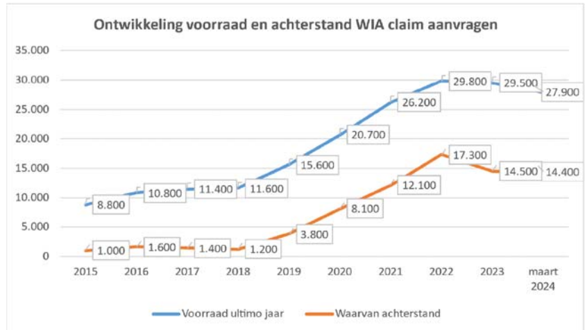
Figuur 2: ontwikkeling van de achterstanden bij de WIA-claimbeoordeling (aantal aanvragen waarvoor de wettelijke termijn van acht weken is verstreken) en van de totale werkvoorraad (aantal aanvragen nog binnen de wettelijke termijn plus de achterstanden).

Door extra inzet voor de mensen die lang wachten op een WIA-claimbeoordeling is het aantal mensen dat langer dan zes maanden wacht op een beoordeling verder gedaald. Medio 2023 ging het om 6.800 mensen en ultimo 2023 nog om bijna 3.100 mensen. In de eerste maanden van 2024 is er geen sprake van een verdere afname; ook in maart 2024 gaat het om bijna 3.100 mensen die langer dan zes maanden wachten. Deze stabilisatie is een gevolg van de toename van het aantal WIA-aanvragen. De inzet van UWV is om ervoor te zorgen dat eind 2024 nagenoeg niemand langer dan zes maanden op een beoordeling hoeft te wachten. 8