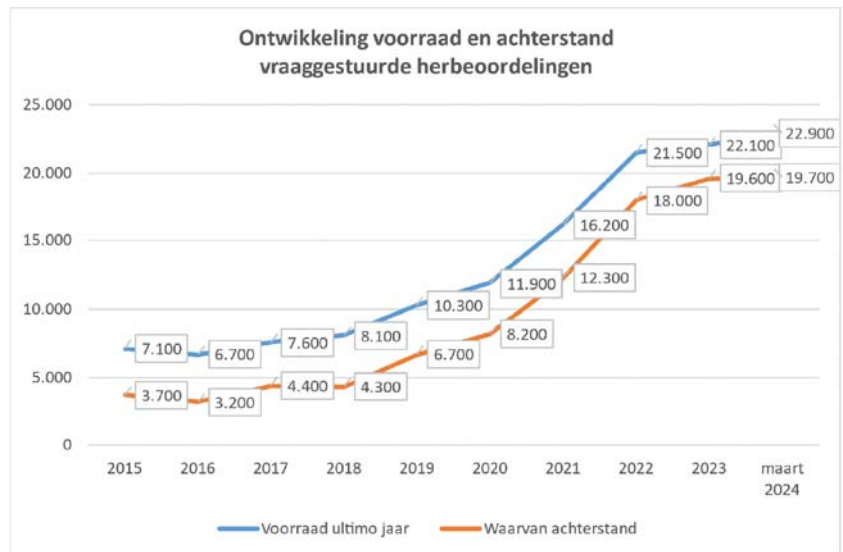
Figuur 4: Ontwikkeling van de achterstanden bij de vraaggestuurde herbeoordelingen (aantal aanvragen waarvoor de wettelijke termijn van acht weken is verstreken) en van de totale werkvoorraad (aantal aanvragen nog binnen de wettelijke termijn plus de achterstanden).

Op dit moment is er nog geen sprake van een daling van de achterstand op de herbeoordelingen. Ook de komende periode verwachten we geen daling, omdat de reeds ingezette maatregelen vooral zien op de WIA-claimbeoordeling. Aan de WIA-claimbeoordeling wordt prioriteit gegeven, omdat we zo snel mogelijk duidelijkheid willen bieden over het recht op een uitkering en daarmee ook duidelijkheid over inkomenszekerheid.