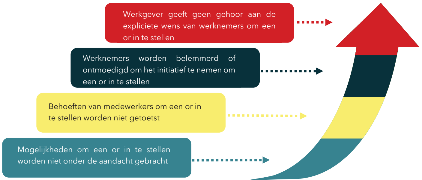
Figuur S.1 De verschillende treden van niet-naleving

Niet-naleving neemt in de praktijk dus meerdere vormen aan: ontoereikende inspanningen vanuit de werkgever om een or in te stellen en/of inspanningen van de werkgever om het initiatief vanuit werknemers nadrukkelijk te belemmeren. Dit neemt niet weg dat werkgevers wel degelijk inspanningen verrichten om hun verplichtingen omtrent medezeggenschap na te komen. Een deel van de werkgevers kan naar eigen zeggen niet veel doen aan het feit dat een or ontbreekt en geeft aan dat zij voldoende inspanningen verrichten om hun verplichtingen na te komen. Dat een or ontbreekt, zien zij als een gevolg van een gebrek aan behoeften onder werknemers aan een or.