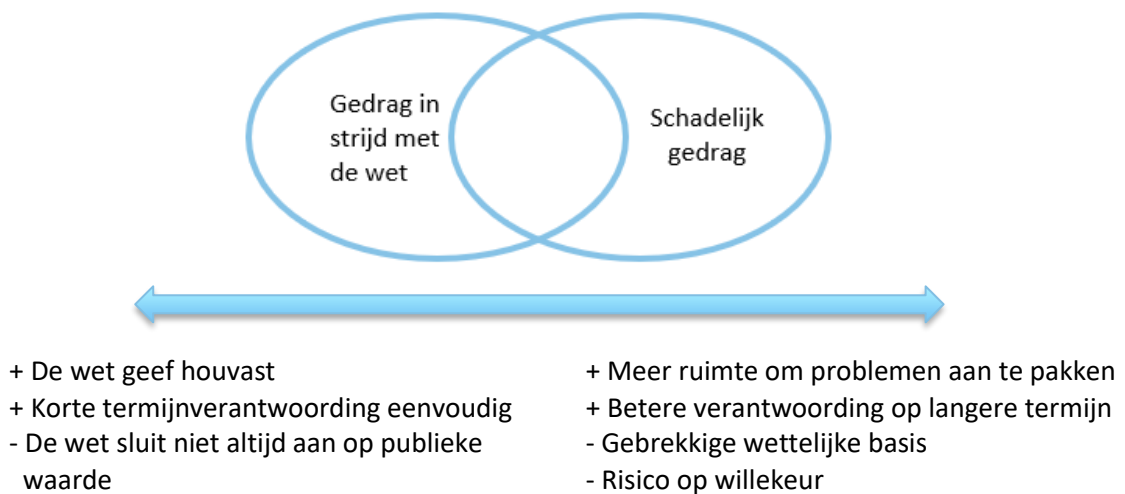
FIGUUR 5.1 GEDRAG IN STRIID MET DE WET EN SCHADELIJK GEDRAG 51

Daarnaast is het zinvol een risicoanalysemethodiek te ontwerpen waarin onderscheid wordt gemaakt tussen verschillende risico-indicatoren. Denk daarbij bijvoorbeeld aan de kwaliteit van processen, toereikendheid van capaciteit, gedrag en cultuur en leiderschap.