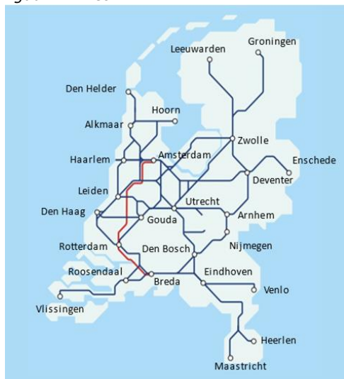
figuur 2 – het HRN

Bovenstaande kaart toont de indeling en omvang van het HRN inclusief de belangrijkste knooppunten en eindstations. Op de blauwe lijn rijden intercity's en sprinters, de rode lijn is de