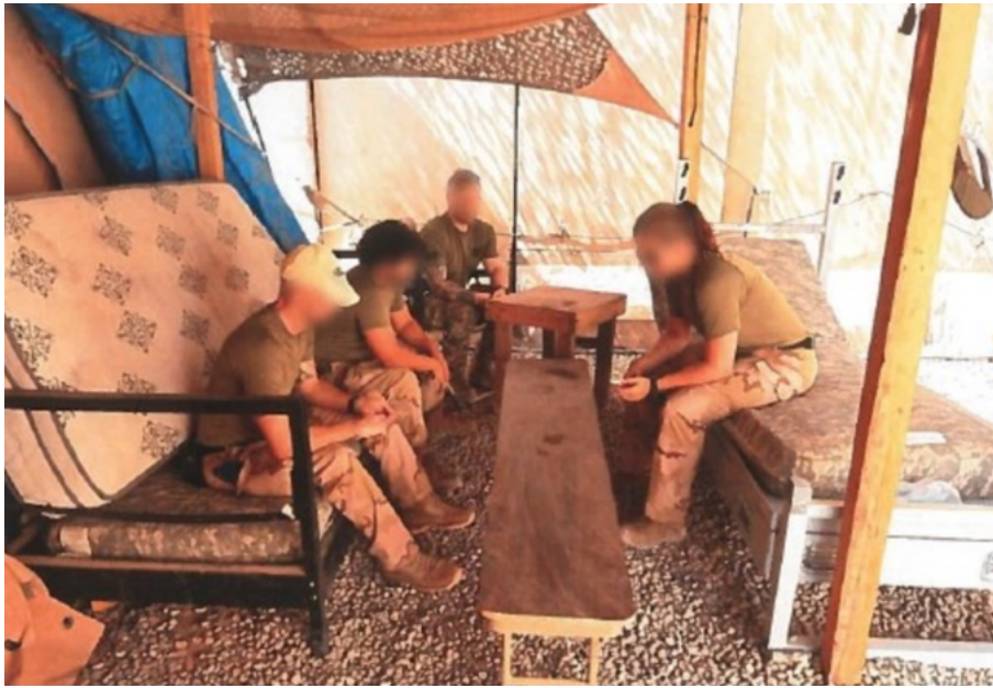
Afbeelding 4: Ongevalslocatie en reconstructie van de situatie tijdens het wapenonderhoud. Van links naar rechts: positie van de schutter, het slachtoffer en een derde en vierde militair.

Voordat de schutter met het wapenonderhoud begon, ontladde hij zijn Glock achter de legeringstent en legde hij de patroonhouder met scherpe munitie naast zich neer op het bedframe. Hierna begon hij met het wapenonderhoud aan de Minimi en de MAG. Toen hij dat had gedaan ging hij verder met het onderhoud aan zijn Glock. Dit bestond uit het uiteennemen, reinigen en ineenzetten van het wapen. Even na 15.00 uur was hij klaar en voerde hij de controle werking uit van de Glock. Hiervoor trok hij de slede van het pistool naar achteren en controleerde hij of er geen patroonhouder in het pistool en geen patroon in de kamer aanwezig was. Na deze handelingen haalde hij wederom enkele keren de slede naar achteren en naar voren. Omdat het naar achteren halen van de slede maar één keer moet en hij dus niet volgens het voorschrift Glock en het Handboek Militair te werk ging, sprak de plaatsvervangend groepscommandant de schutter hierop aan. Kort daarna plaatste de schutter de patroonhouder met scherpe munitie die naast hem lag in zijn Glock en laadde hij - onbewust - het pistool met een patroon in de kamer. Vervolgens haalde hij de trekker over, met de bedoeling de controle werking uit te voeren, en schoot hij in de richting van zijn collega naast hem op het bedframe. Deze militair raakte zeer ernstig gewond.