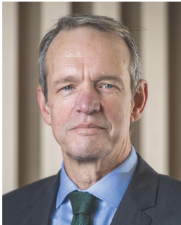
De Inspecteur-Generaal Veiligheid, Wim Bargerbos

De IVD hoopt met dit rapport handvatten te bieden om de benodigde verbeteringen vorm te geven. Zij bedankt alle betrokkenen voor hun constructieve medewerking aan het onderzoek.