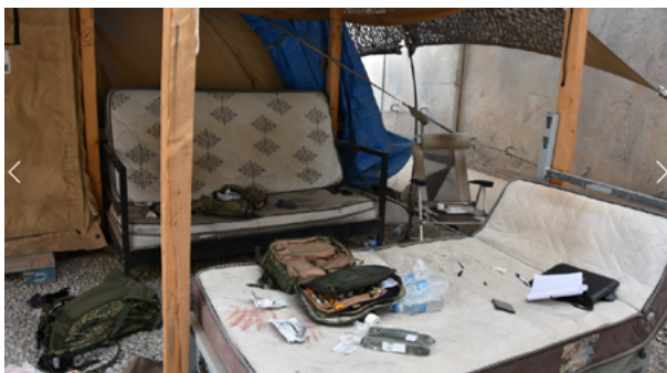
Afbeelding 7: Naast de aangewezen locaties werd ook wapenonderhoud uitgevoerd bij de legeringstenten, zoals op de afgebeelde locatie van het ongeval (bron: proces-verbaal Koninklijke Marechaussee).