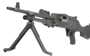
Middelzwaar machinegeweer MAG