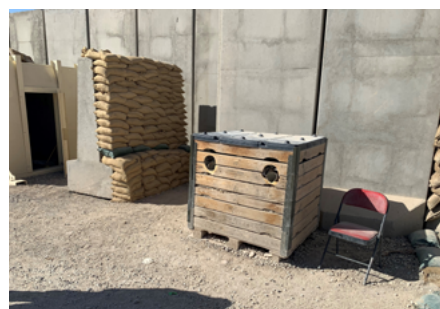
Afbeeldingen 2 en 3: Laad- en ontladinrichtingen parkeerplaats (links) en ingang Camp Bulldog (rechts).