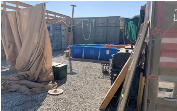
Afbeelding 5: De eerste aangewezen locatie van het wapenonderhoud (2021). Om de omstandigheden te verbeteren, besloot de commandant het onderhoud te verplaatsen. Na de verplaatsing naar de rand van het kamp ontstond op de oorspronkelijke locatie ruimte voor een zwembad.

De locatie van het wapenonderhoud (afbeelding 5) bevond zich oorspronkelijk in het midden van Camp Bulldog . De compagniesleiding verplaatste deze in de loop van 2022 vanwege hitte, stof en instabiele tafels naar de rand van het kamp nabij de legeringstenten (afbeelding 6). De nieuwe onderhoudslocatie was ook erg warm en stoffig, waardoor militairen van het eerste peloton het wapenonderhoud niet daar maar bij de eigen legeringstent uitvoerden. De compagniesleiding gedoogde dit.