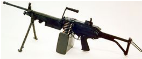
Licht machinegeweer Minimi

Op de dag van het ongeval hield het eerste peloton van de Force Protection compagnie een schietoefening op een schietbaan in Erbil. Vanwege de extreme hitte overdag besloot de commandant van het eerste peloton vroeg in de ochtend met de oefening te beginnen. De oefening was bedoeld om de schietvaardigheden van de militairen te onderhouden en bestond uit het schieten met het pistool Glock 17, het geweer Colt C8 (persoonlijke wapens), het lichte machinegeweer Minimi en het middelzware machinegeweer MAG (groepswapens).