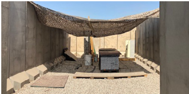
Afbeelding 6: De tweede aangewezen locatie van het wapenonderhoud (medio 2022). Hier waren de omstandigheden echter ook niet optimaal, want het was eveneens warm en stoffig.