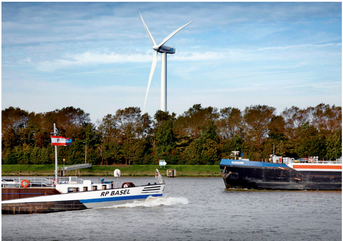
Foto ter illustratie: twee binnenvaartschepen (niet betrokken bij het strafrechtelijk onderzoek)

Er lijkt een leemte te zijn binnen het opleidingsstelsel voor wat betreft het houden van toezicht op het geheel. Er is in het huidige stelsel geen bredere toezichthoudende rol weggelegd voor de drie instanties die betrokken zijn bij het verzorgen van opleidingen, afleggen van examens en verstrekken van vaarbewijzen. Dit maakt dat het stelsel mogelijk fraudegevoelig is. Dit – het verstrekken van stickers zonder controle op het daadwerkelijk volgen en met goed gevolg afronden van de opleiding (examen) - is een wezenlijk onderdeel gebleken in het tewerkstellingsproces dat uiteindelijk heeft geleid tot de arbeidsuitbuiting van Filipijnse matrozen in de Nederlandse binnenvaart.