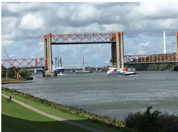
Foto ter illustratie: een binnenvaartschip op de Oude Maas ter hoogte van de Sijkenisserbrug (niet betrokken bij het strafrechtelijk onderzoek)

De bewijsvoering met betrekking tot het strafbare feit van arbeidsuitbuiting is opgebouwd aan de hand van verschillende elementen. Cumulatief leidden deze volgens het OM en de Inspectie SZW in deze casus tot de slotsom dat de Filipijnse bemanningsleden die tewerkgesteld werden op de binnenvaartschepen, het slachtoffer zijn geworden van uitbuiting 5 . In deze zaak gaat het overwegend om de volgende elementen.