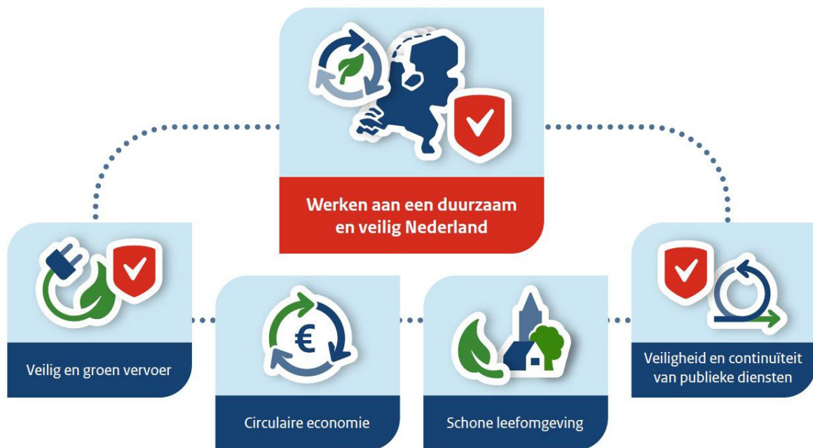
Afbeelding 2: Werken aan een duurzaam en veilig Nederland

De onderwerpen zijn in vier thema's verdeeld om de onderlinge samenhang zichtbaar te maken. Deze thema's zijn gebaseerd op de door het ministerie van IenW gedefinieerde maatschappelijke opgaven en transities en laten zien hoe de ILT daaraan een bijdrage levert.