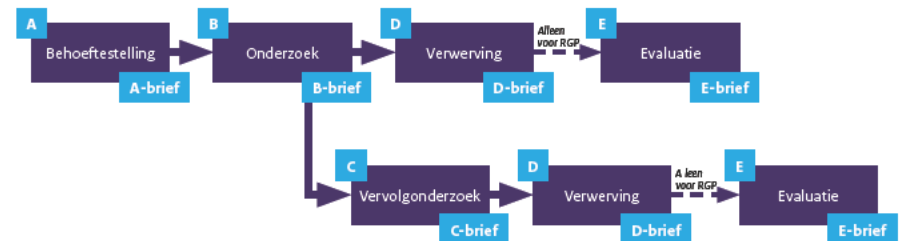
Figuur 1: Processchema DMP

Investeringsprojecten tussen de € 50 miljoen en € 250 miljoen worden na de A-fase gewoonlijk door de staatssecretaris van Defensie gemandateerd aan de ambtelijke organisatie (Kamerstuk 27 830, nr. 379 van 1 november 2022). Mandatering van projecten van meer dan € 250 miljoen is mogelijk in het geval van eenvoudige, weinig risicovolle en politiek niet gevoelige investeringsprojecten met een grotere financiële omvang, of als feitelijk al vast staat hoe de behoefte moet worden vervuld omdat er maar één aanbieder is of weinig aanbieders zijn. Ook is mandatering aan de orde als het gaat om kapitale munitie. Indien een project van meer dan € 250 miljoen wordt gemandateerd, zal de A-brief in ieder geval ingaan op de projectrisico's en het al dan niet voorhanden zijn van verwervingsalternatieven.